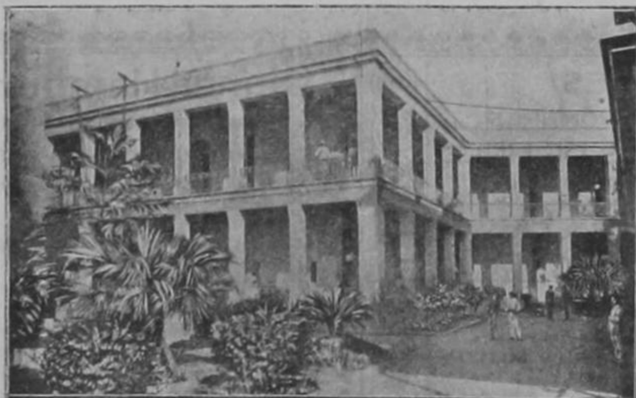
Departamento "Segundo Alvarez"