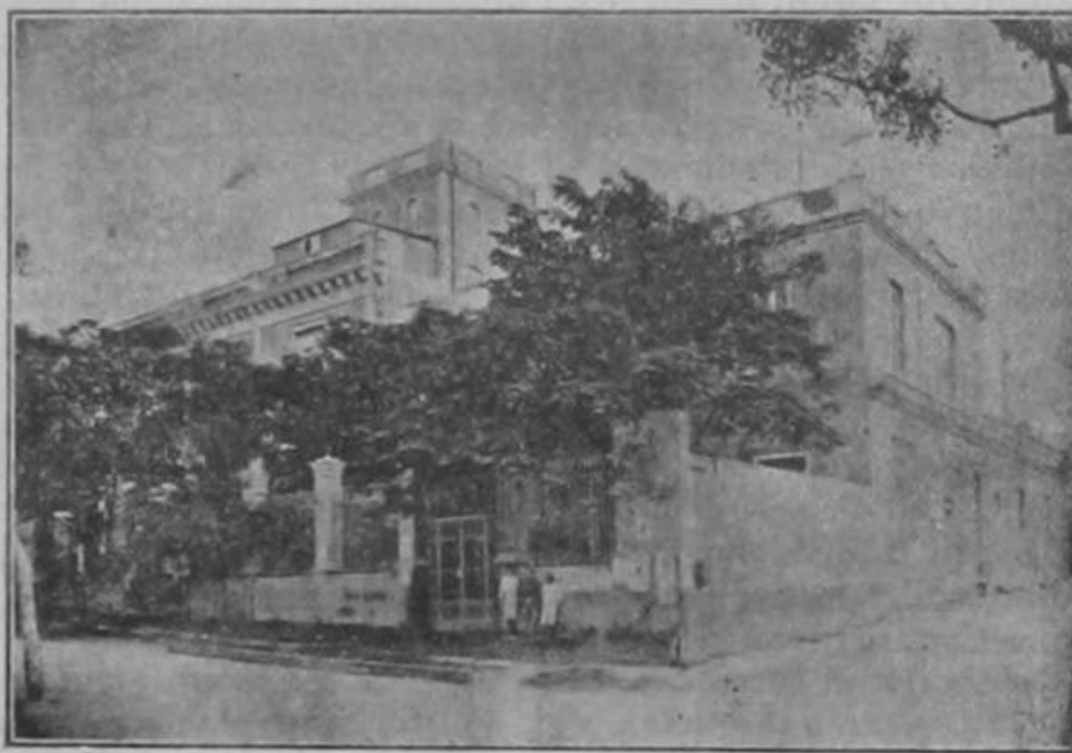
Vistas exteriores de la Casa de Salud

Hace más de veinte años, existía en la Habana un «Centro Canario de Instrucción y Recreo», semejante á los demás de nuestras provincias y regiones peninsulares. Mas parece que decayó, vino á menos y hubo de acabarse, con motivo de los trastornos políticos de los últimos tiempos coloniales.