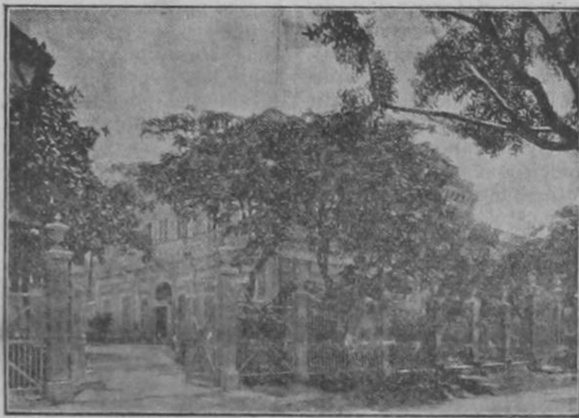
ASOCIACION CANARIA EN CUBA

«El actual movimiento canario, intensivo y extensivo á la vez, invadirá pronto todo el país, del oriente al occidente y del septentrion al mediodía, llevando por doquiera, no el pendón de la guerra sangrienta y cruel que asuela los campos y mata la agricultura, segando en flor los productos de la tierra y las esperanzas del labrador, sino el