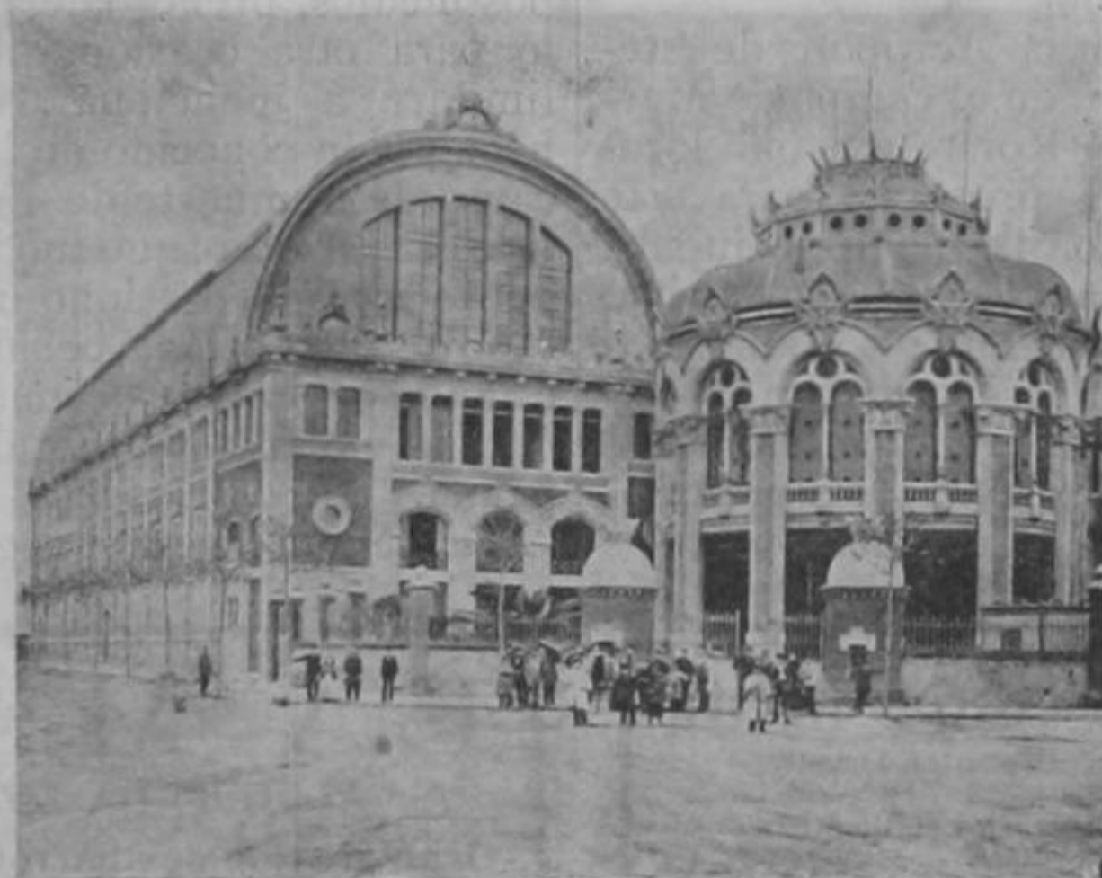
Fachada del Frontón Barcelonés

guo, elegante y aristocrático ejercicio de la pelota, digo, de aquel que se juega con las manos y los brazos, no con las extremidades inferiores y menos nobles del organismo humano.