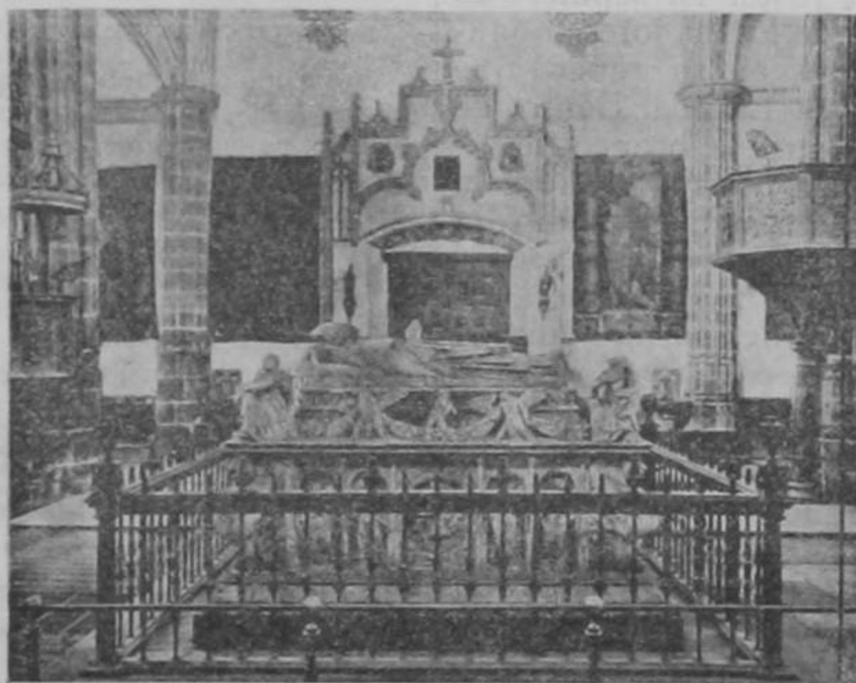
Sepulcro del Cardenal Cisneros en Alcalá de Henares

El 14 de marzo de 1498, el Cardenal, siguiendo los planos del arquitecto Pedro Gumiel, colocó la pri-