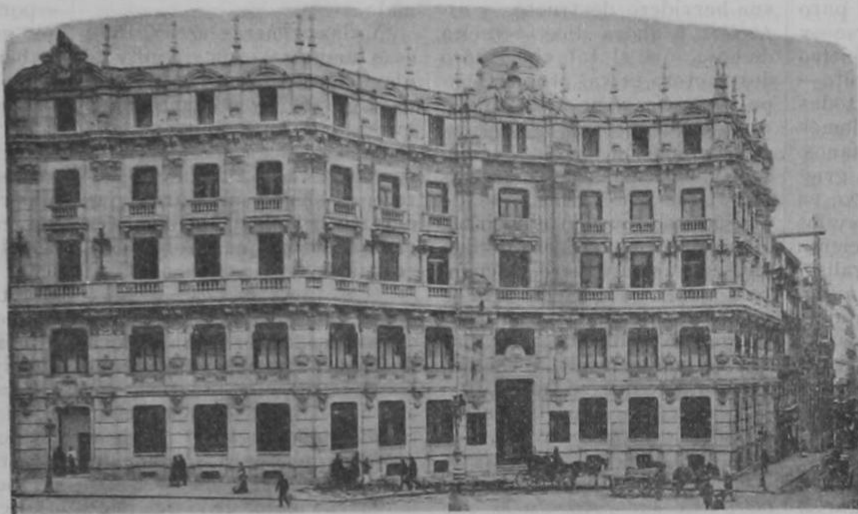
Banco Hispano Americano en Madrid

ellas la cara es el espejo del alma; pero es más gráfico aún, cuando de entidades financieras se da cuenta, representar con números el volúmen de sus operaciones y ganancias y así vamos á hacerlo en el presente caso, reproduciendo el resumen del balance practicado por el Banco Hispano-Americano en enero del corriente año. Es el siguiente: