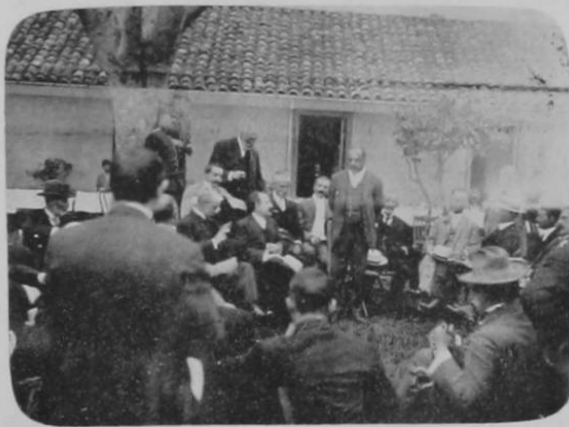
Fiesta íntima en obsequio del señor Presidente de la República Instantáneas tomadas después del almuerzo en la finca "Herrán"

ro tal es la condición humana, bien distante de una absoluta perfección.