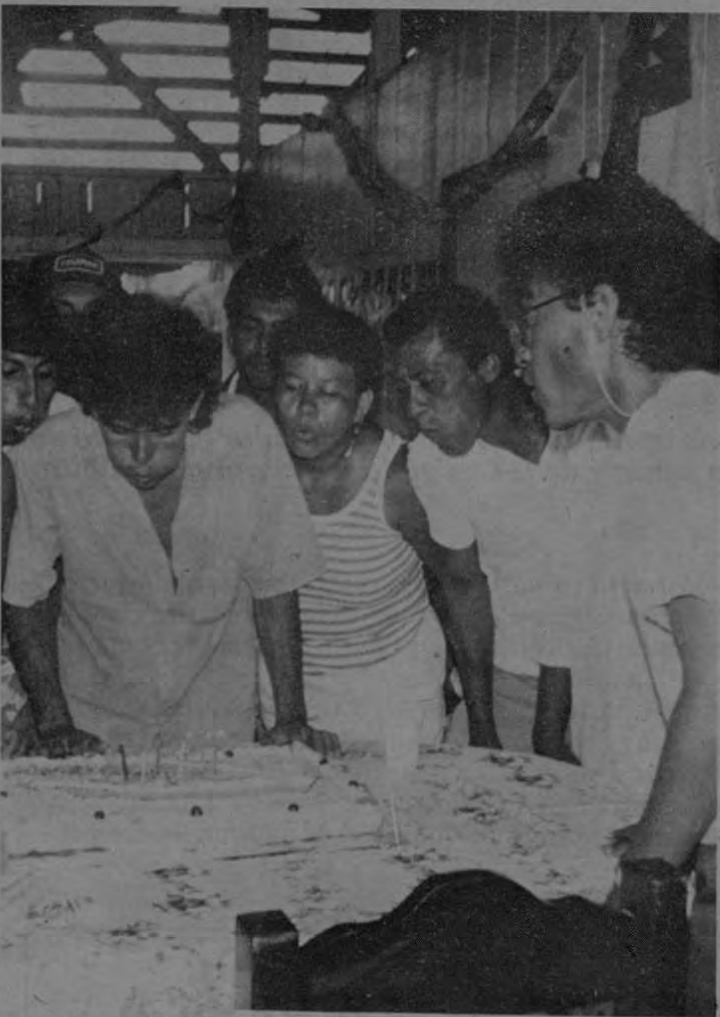
Momento en que algunos de los Asociados de la cooperativa apagan las velas del queque en conmemoración de setimo aniversario.