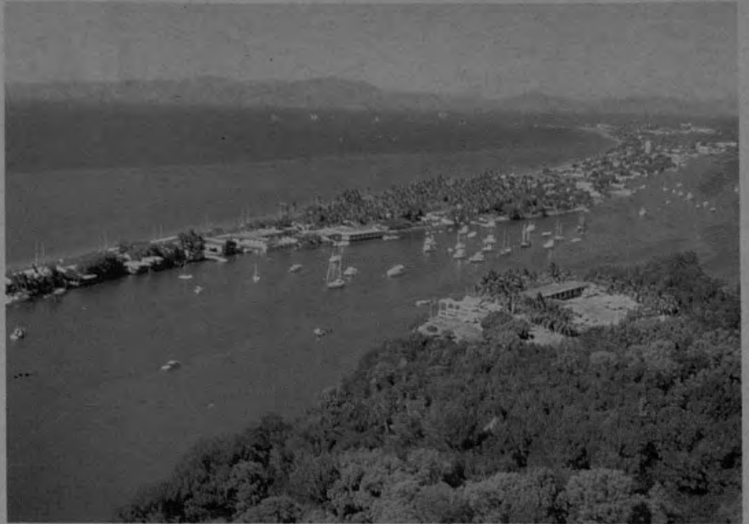
En esta foto aérea se puede apreciar en todo su esplendor el Puerto de Puntarenas. En el estero y parte de los manglares se aprecia el club de yates.

Una vez en el PUERTO, como se le llama comúnmente a Puntarenas, podrá desplazarse a playas de Boca Barranca y Doña Ana, en donde el Instituto Costarricense de Turismo ha construido muy buenas instalaciones, a las playas aledañas a la ciudad o hacer excursiones interesantísimas por el Golfo de Nicoya. Para éstas puede contratar un bote en Puntarenas o aprovechar las excursiones que hacen algunos yates y lanchas en el día domingo. Si desean hacer un viaje por la Península, la Cooperativa nacional de Transportes Marítimos R.L., les pone a su servicio su Ferry Salinero en donde lo puede llevar con su propio vehículo hasta Playa Naranja, desde aquí es fácil desplazarse a Paquera, Jicaral y otros lugares. Otro viaje muy interesante por la ruta Interamericana Lagartos Guacimal, Santa Elena, es hasta la colonia de los cuáqueros de Monteverde con magníficas vistas y un clima agradabilísimo, aquí hay hoteles y se consigue alimentación nacional e internacional. Por la misma ruta el viajero puede visitar lugares muy pintorescos; Costa de Pájaros y Manzanillo, con la entrada de Arizona. Interamericana, Punta Morales, en donde funciona una faja transbordadora de azúcar y la mayor destiladora de alcohol del país, tanto para consumo interno como para la exportación. Mata Limón es