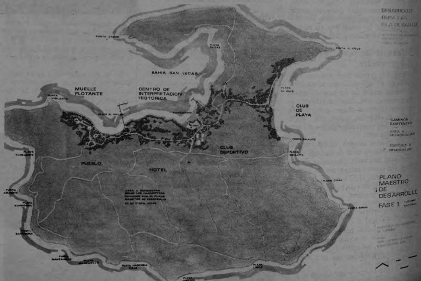
Plan Maestro del desarrollo Turístico de la Isla de San Lucas.

Esta acción debe formar parte de un plan integral para la solución de los problemas que afectan a esta importante región del país.