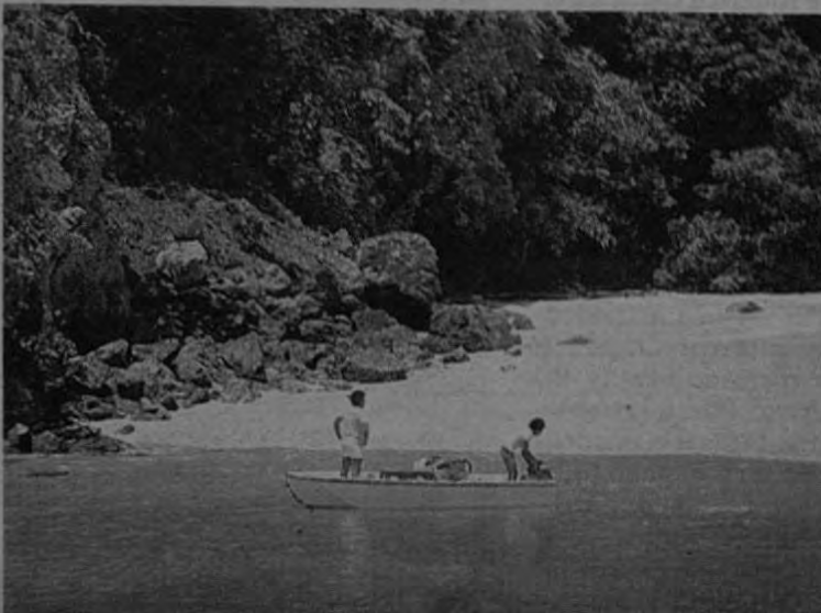
Romántica playa de la Isla de San Lucas.