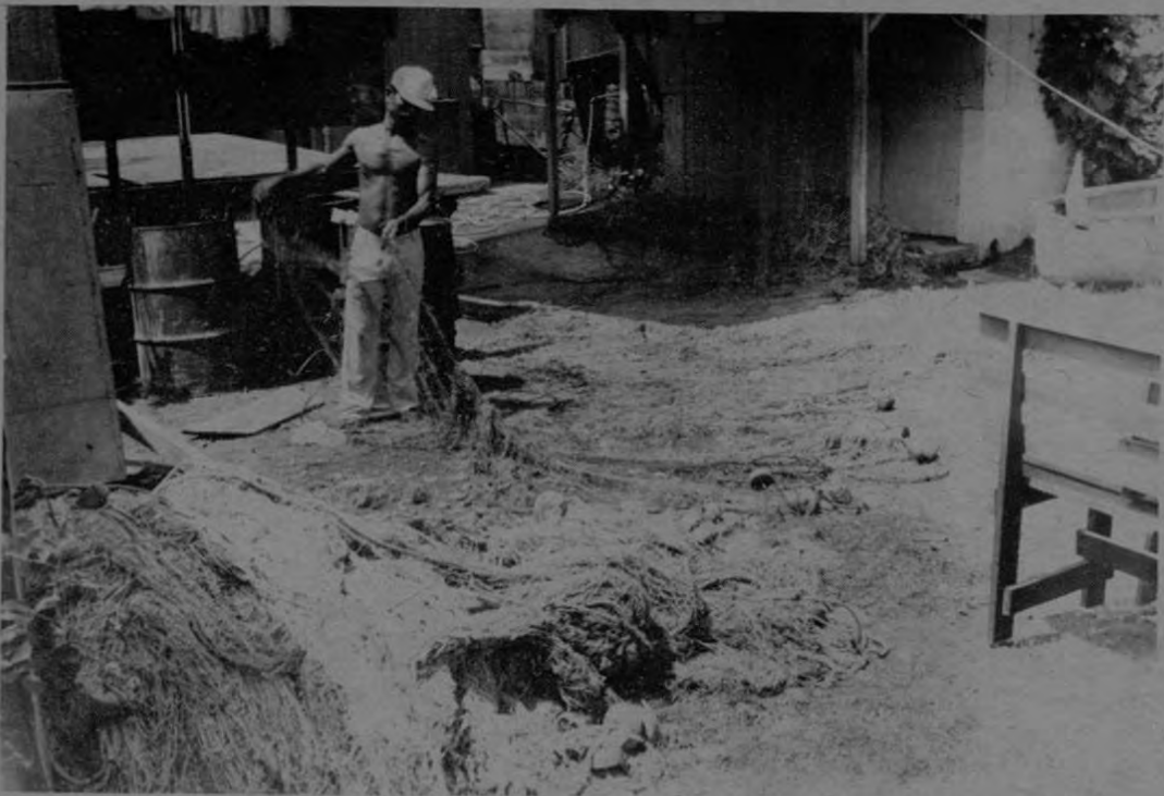
En la gráfica un técnico en reparación de redes trabajando en las instalaciones de la Cooperativa.