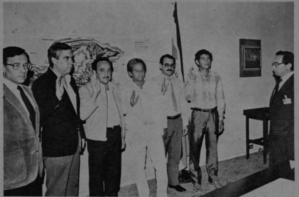
Juramentación de la comisión para el desarrollo turístico de la Isla de San Lucas.