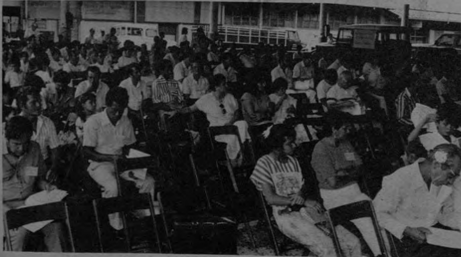
Vista parcial de la concurrencia de afiliados a la Asamblea General de UNEMOP.