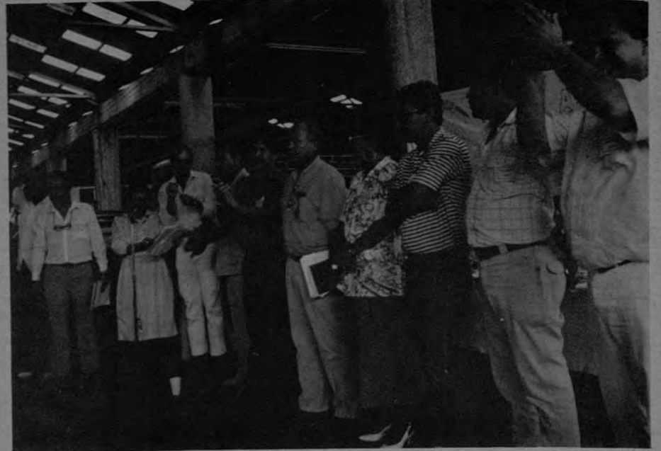
De pie algunos reelectos y otros miembros de la nueva Junta Directiva de UNEMOP.