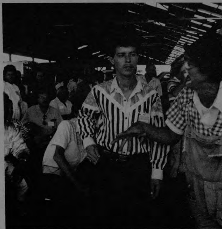
El afiliado más nuevo de UNEMOP. Ingresó recientemente lleno de esperanza para recibir los beneficios de esta organización: vivienda, salud, salarios, odontología, abogados para la defensa de sus derechos, tiendas etc.

D. Otros que le asignen estos estatutos.