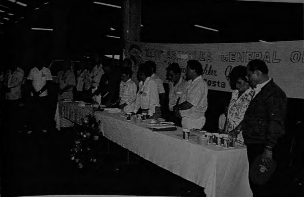
Papeleta ganadora. Miembros actuales del Directorio Nacional de UNEMOP.

MEJORAMIENTO TECNICO: No se ha podido cumplir con lo aprobado en el plan de trabajo para tecnificar la sede de Unemop.