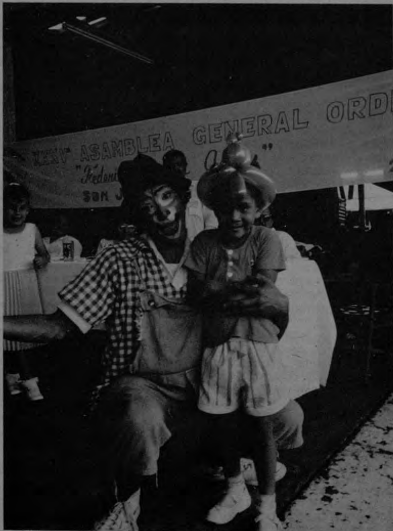
En la Asamblea General de UNEMOP también hubo alegría para los niños. Este payaso posa para EL IMPARCIAL.

RELACIONES PUBLICAS: Con orgullo manifiesto las relaciones armoniosas con los grupos organizados del MOPT. Como ejemplo manifiesto que participé en una mesa redonda, el día internacional de la Mujer, considerándose la unificación del movimiento sindical y otros grupos del MOPT.