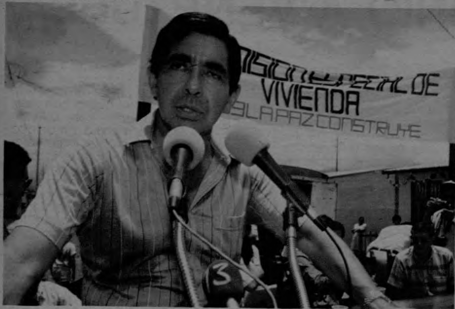
Presidente Arias inaugura Proyecto de Vivienda EL CHAGUITE, en Puntarenas.