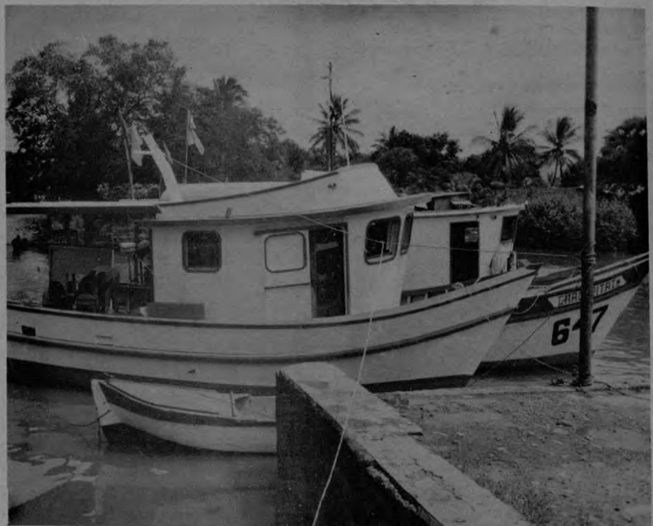
Parte de la flota pesquera de COOPECHAPU R.L. : Las Chacarita I y II.