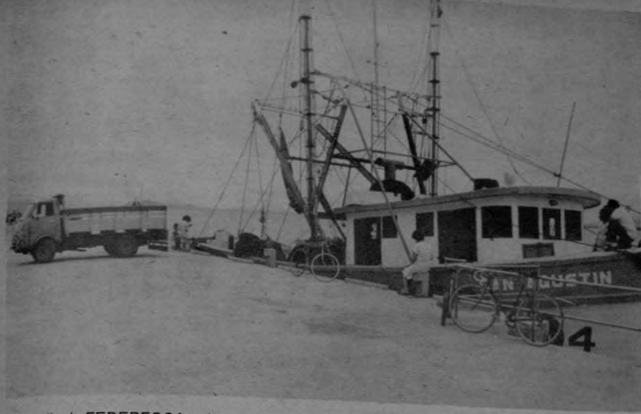
El muelle de FEDEPESCA todo un complejo en beneficio de los pescadores organizadores de cooperativas.