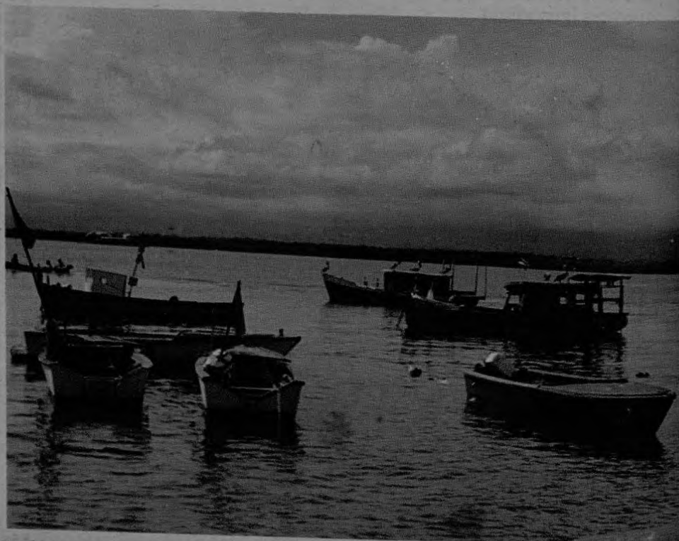
Pescadores artesanales buscan su integración a COOPECHAPU R.L. por las muchas garantías que reciben.

Prácticamente lo que se está efectuando es la llamada "LEY DEL EMBUDO" todos los capitales quedan en pocas manos mientras que el pescador artesanal sigue adoleciendo y afrontando todos los problemas que hasta ahora se han presentado.