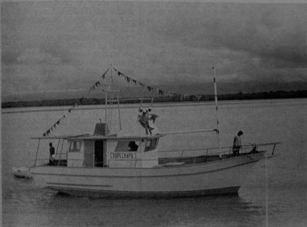
Nueva embarcación COOPECHAPU I, su motor es marca CUMMINS y tiene una capacidad de 250 caballos a 2.500 revoluciones por minuto.