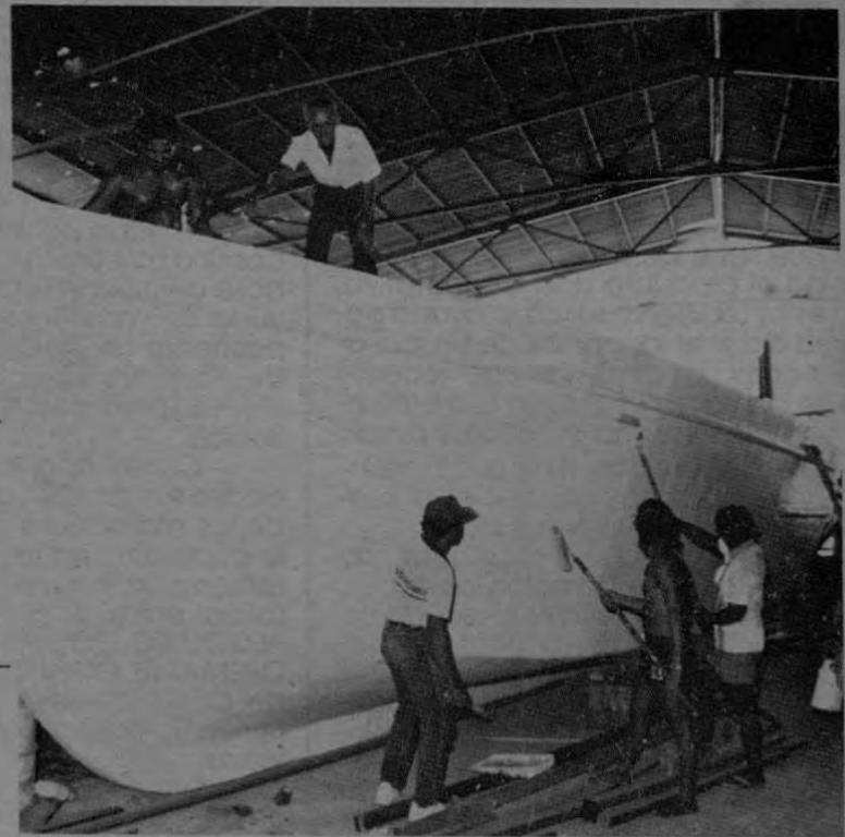
La Cooperativa de Pescadores de Chacarita de Puntarenas y Servicios Múltiples (COOPECHAPU R.L.) recibió asistencia técnica y un crédito por $2 millones 300 mil para la construcción de una embarcación de alta capacidad. Los asociados construyeron el barco y administran adecuadamente la cooperativa.