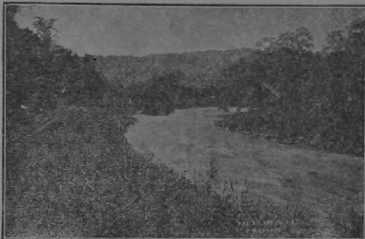
Vista en la línea del Ferrocarril á Limón

Y en medio de estos dos bandos, aparece en gestación ahora, ya en las postrimerías de la campaña, sin programa, sin derroteros