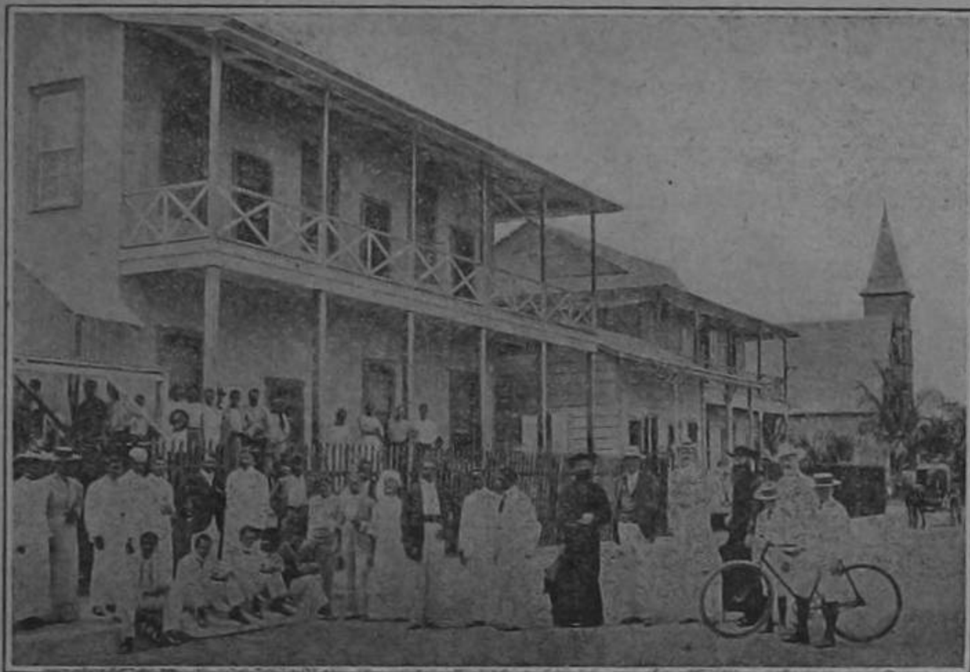
UNA VISTA EN PUERTO LIMÓN

don Cleto al ver que sólo civiles , que sólo diablos colorados suscriben el memorial de marras? Pues nada! ¿dirá don Cleto que don Maximino es neutral como deben serlo las autoridades que cumplen con su deber? Nunca! Don Cleto no es tonto! ¿Por qué los republicanos no piden que quede Maximino? Porque este borreguito es más diablo colorado que Clemente Diablos el de la cantina.