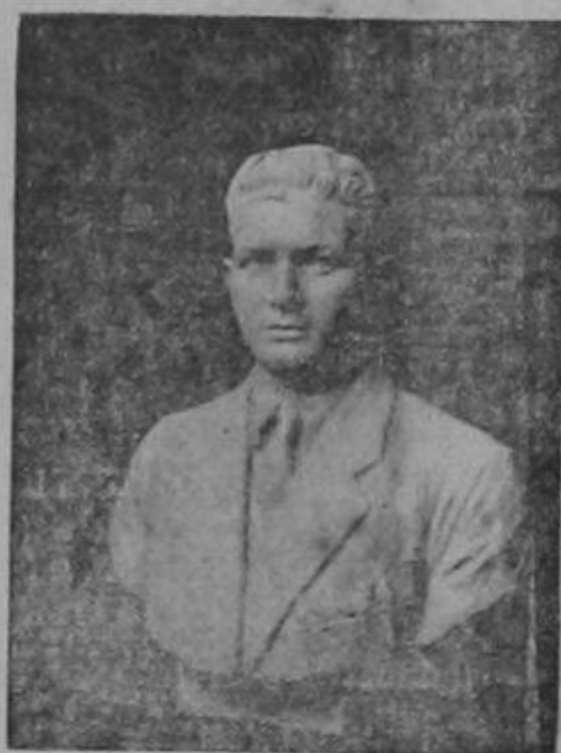
Don Rafael M. Ureña.—Obra escultórica en mármol delineada por el señor Portuguez

tenemos aquella vitalidad de energía y de nobleza de alma, tenemos que sentirnos compungidos y abatidos ante su figura de mármol, es tan perfecta que parece que le animara el alma, el busto del artista supo ser el interprete de los delineados que