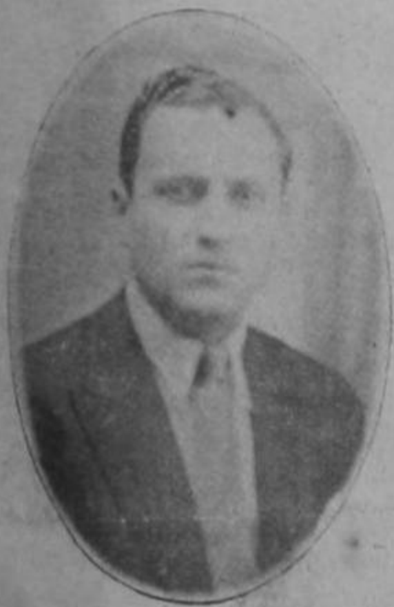
Don Rafael Calderón Guardia

y esto es más o menos lo que la conciencia pública consciente dice que será en la elección de diputados que se avecina.