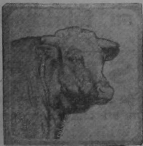
Toro de la hacienda de SIR RICHARD COOPER que ha ganado el primer premio en varias exposiciones

EL MEJOR REMEDIO, y el más barato, para la destrucción de las GARRAPATAS en el ganado vacuno, caballar, mular, etc.