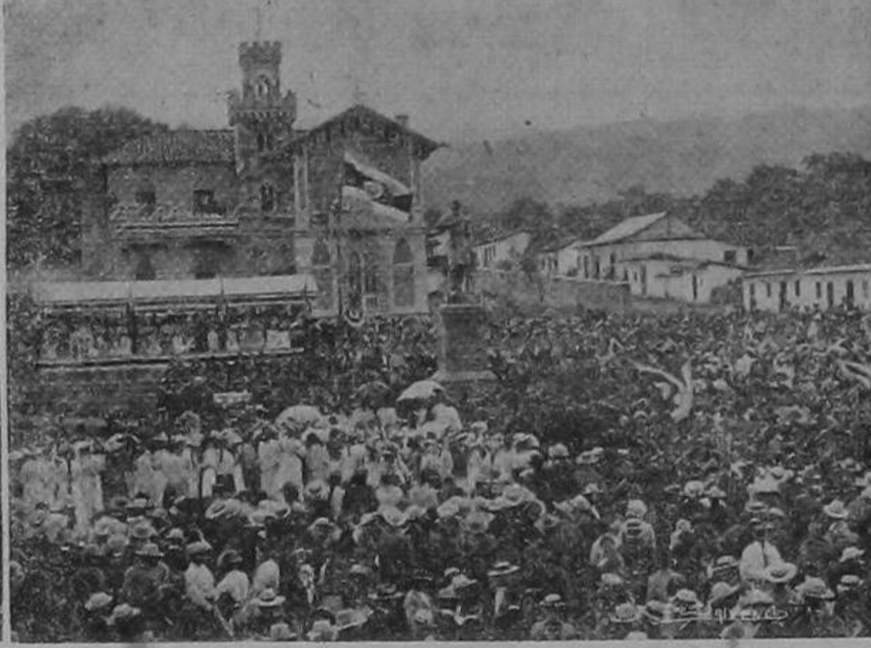
Inauguración de la Estatua del Ilustre Patricio Lic. don Jesús Jiménez Zamora el 18 de junio de 1903