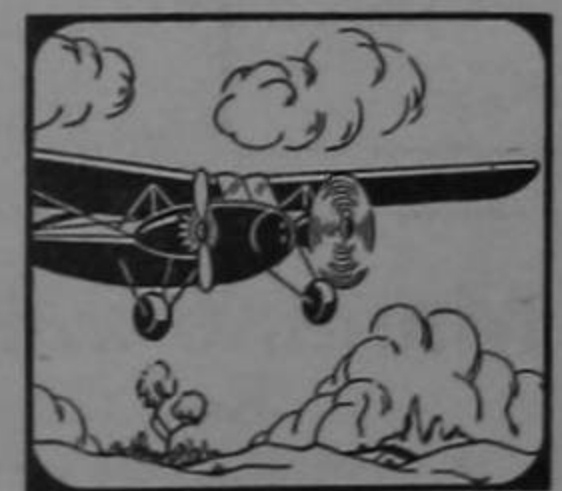
Los Bimotors «Kingbird» pueden volar con un solo motor en caso de emergencia.

El placer de volar está en la seguridad, en la confianza.