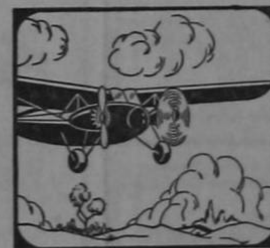
Los Bimotors «Kingbird» pueden volar con un solo motor en caso de emergencia.