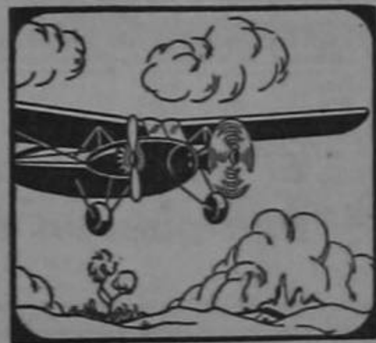
Los Bimotors «Kingbird» pueden volar con un solo motor en caso de emergencia.