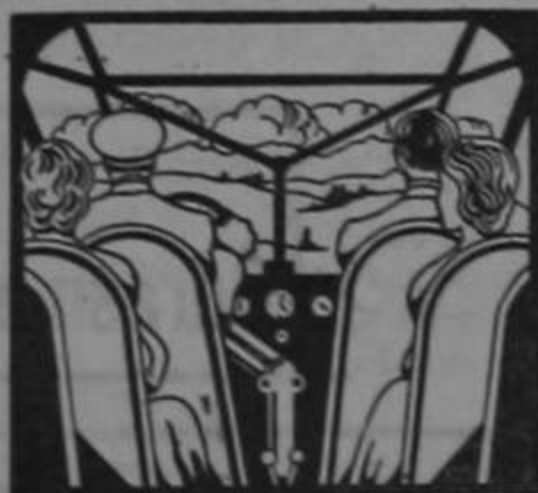
El placer de volar está en la seguridad, en la confianza.

Cuando Ud. vuela en BIMOTOR viaja tranquilo, descansado, sabiendo que lleva un motor de reserva que llevará al avión felizmente al próximo campo de aterrizaje en caso de emergencia