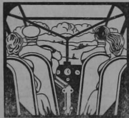
El placer de volar está en la seguridad, en la confianza.

¡Qué diferencia volar tranquilamente observando el paisaje, en vez de ir pendiente del motor! La angustia afecta los nervios, agota al pasajero, causa malestar. Cuando Ud. vuela en BIMOTOR viaja tranquilo, descansado, sabiendo que lleva un motor de reserva que llevará al avión felizmente al próximo campo de aterrizaje en caso de emergencia