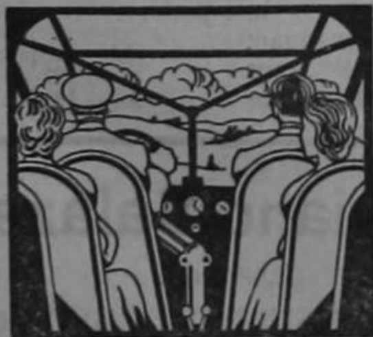
El placer de volar está en la seguridad, en la confianza.

Cuando Ud. vuela en BIMOTOR viaja tranquilo, descansado, sabiendo que lleva un motor de reserva que llevará al avión felizmente al próximo campo de aterrizaje en caso de emergencia