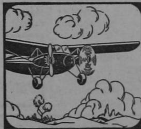
Los Bimotres «Kingbird» pueden volar con un solo motor en caso de emergencia.