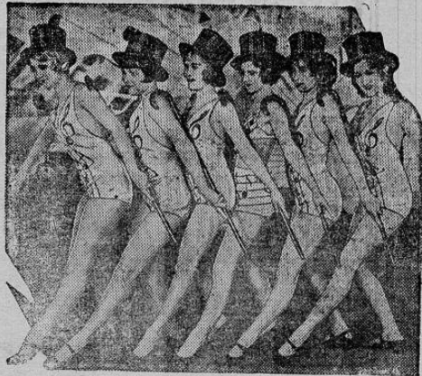
Chorus in a scene from "THE HOLLYWOOD REVUE"

La Empresa de nuestro Coliseo de Moda, Teatro Sun Yat Sen, anuncia para el domingo 16 de los corrientes, otra grandiosa y estupenda super producción parlante, bailada y musicada de gran fama, producción de la famosa casa Metro Goldwyn Mayer que lleva por título LA REVISTA DE HOLLYGOOD que es una preciosidad, ya por la variación de la misma como por las muchas escenas en colores que se suceden en los escenarios de aquella gran urbe del arte mudo y hablado que se llama Hollywood.