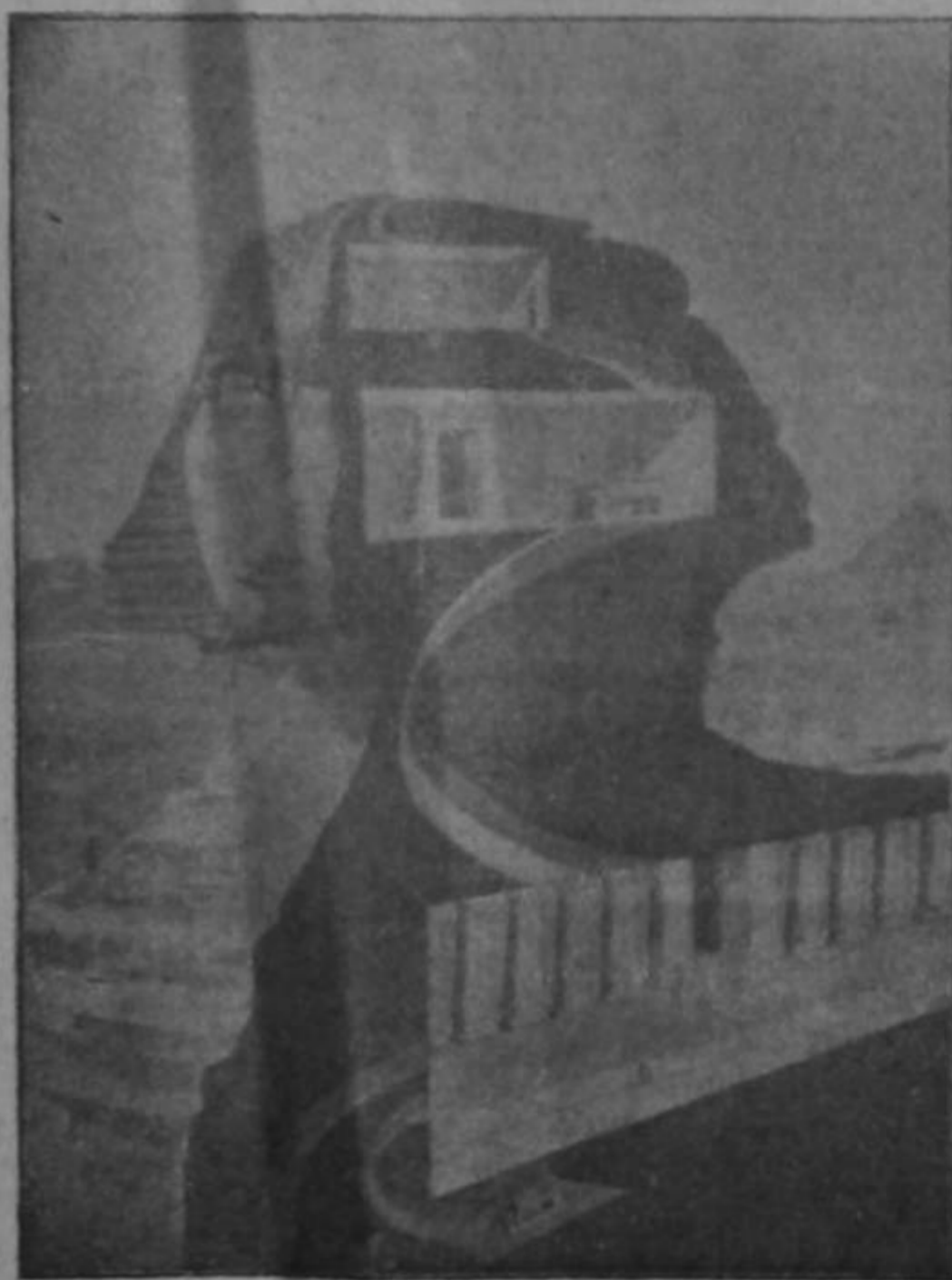
Vista de diagramática de los descubrimientos que se hicieron recientemente de templos escondidos dentro de la Esfinge

A. El primero de una serie de templos unidos dedicados al sol, que aparecen en la cabeza y cuerpo de la Esfinge; B, 14 pies de ancho por 60 de largo; C, Pirámide de Khafra; D, Templo principal que llena el cuerpo de la Esfinge y que se comunica por medio de túneles con otros templos y tumbas en varias direcciones; E, Pirámide hueca que se supone que contiene la tumba de Menes, primer Faraón histórico del Alto y Bajo Egipto; F, Templo entre las garras anteriores de la Esfinge.