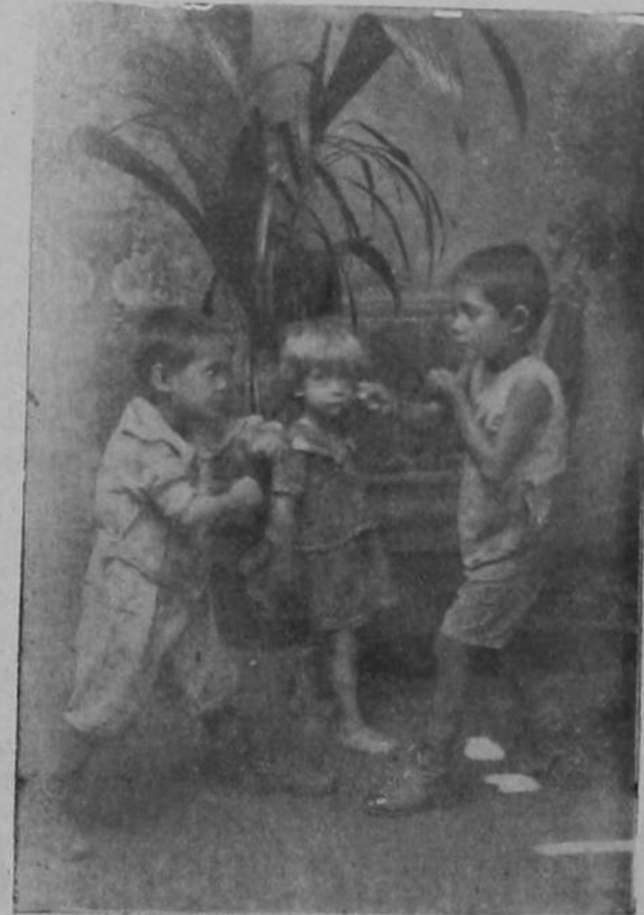
Discutiendo el regalo de Noche Buena

Vayan para todas las cultas asociadas nuestras sinceras felicitaciones.