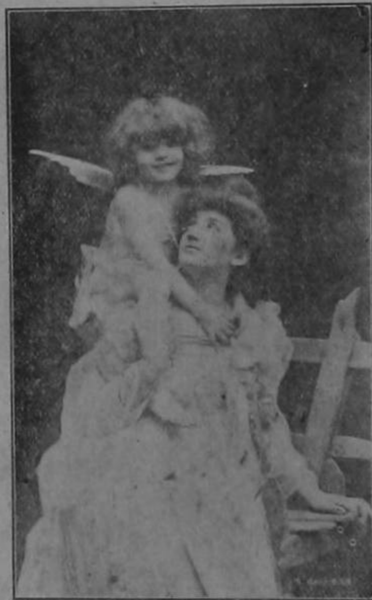
Visión de Noche Buena

Nosotros los latinos,—poco fenicios—no daremos nunca preferencia a sus serruchos y palas de vapor, sobre las finas, gráciles y cinceladas muñecas de Turingia o sobre los mobiliarios diminutos de la Sajonia Meridional.