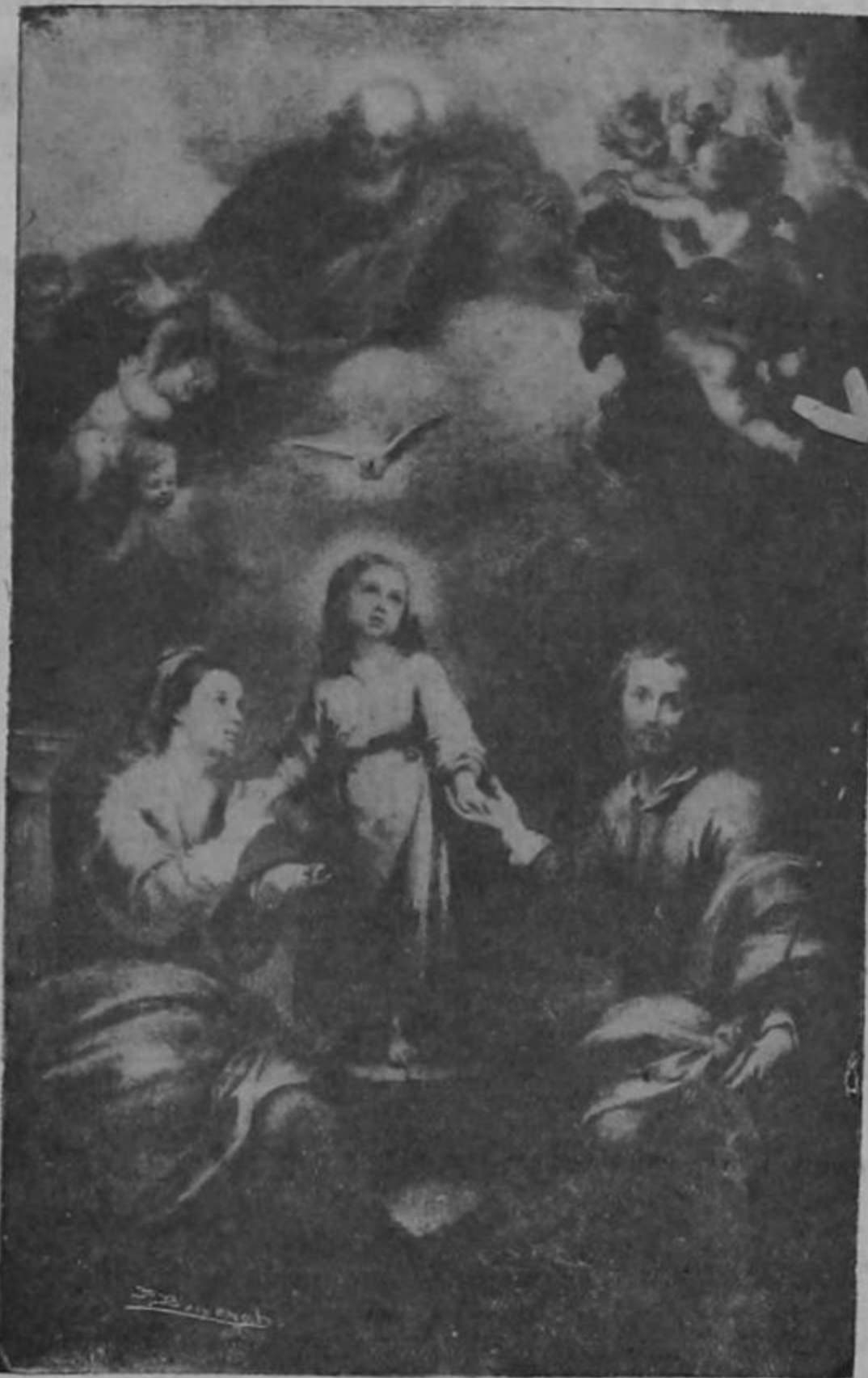
La Sagrada Familia imaginada por Murillo