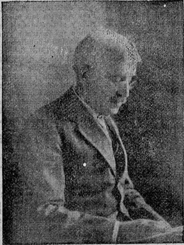
Profesor John Dewey, de quien se toman algunos apuntes en este libro

Sus metodologías son magnífico auxiliar para los maestros, porque dan idea precisa sobre la manera de tratar cada asignatura, dejando al mismo tiempo un margen suficiente para la ampliación de aquellos métodos y para aplicar todo lo original y de eficiencia experimentada. Así lo vemos en la enseñanza de la Higiene y en la Educación Cívica, en que se tratan problemas de moral social y de gobierno, trascendentes para el niño y luego para la colectividad en la que él desarrollará sus actividades. Las ciencias, las letras, las artes, ocupan lugar en su frase, con buen acopio de detalles de orden utilitario o didáctico. La enseñanza del Lenguaje, para no citar otra asignatura, que su trabajo resume en ejercicios de expresión oral, lectura y escritura simultáneas, dictado y composición, lleva indicada su metodología, en todos los casos ajustada a un procedimiento natural y lógico. Interpreté, y así me parece muy bien, que su libro recomienda la composición oral y sistemática en todos los grados, antes