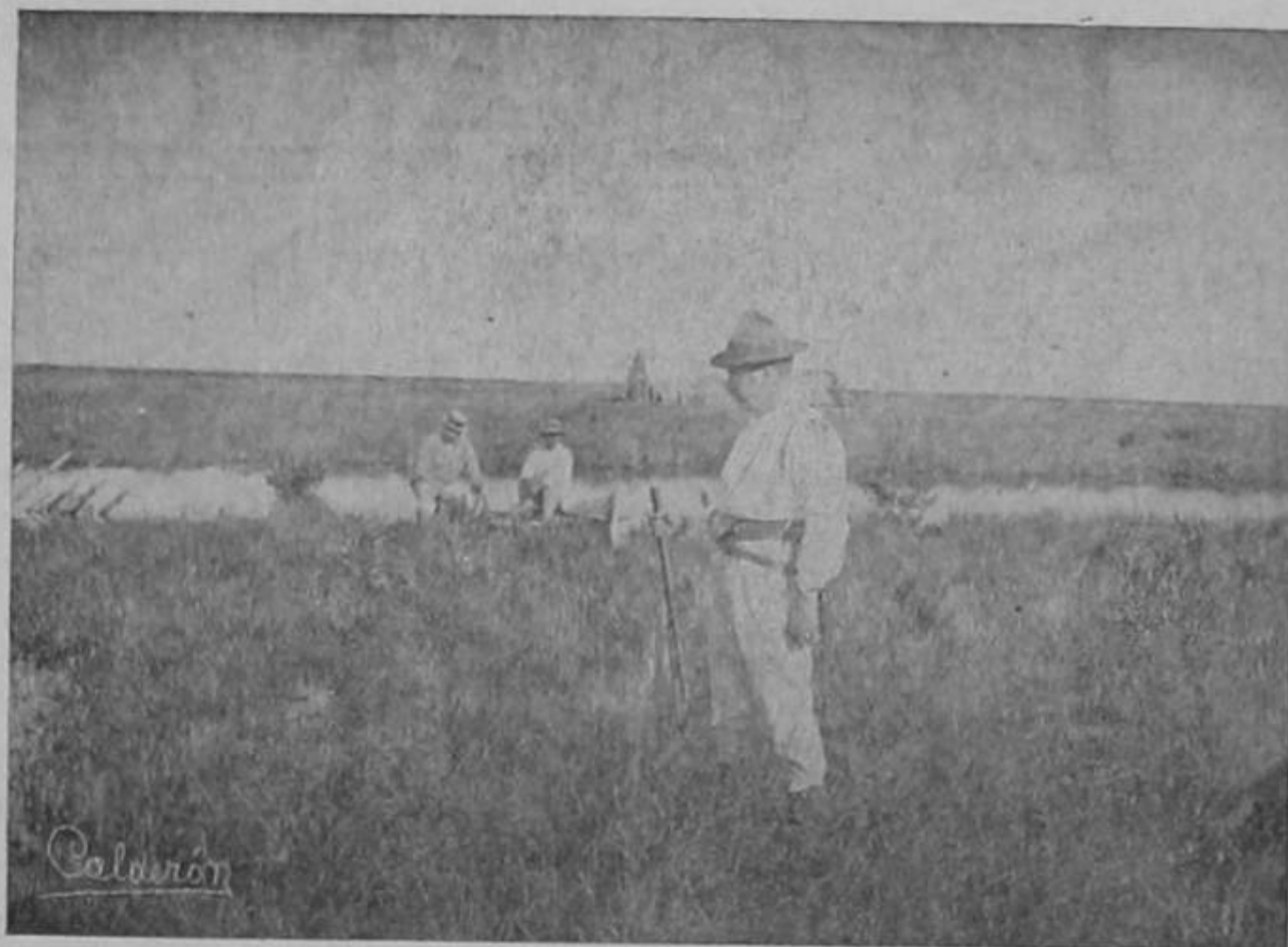
Vista del proyectado Puerto del Tortuguero

Y no hubo ni jeronima, el buen muchacho, que aspiraba á hacerse de algunos reales, de cualquier manera, para contraer matrimonio con una guapa moza que lo tiene medio ido, fué á entenderse con uno de los señores Agentes de Policía.