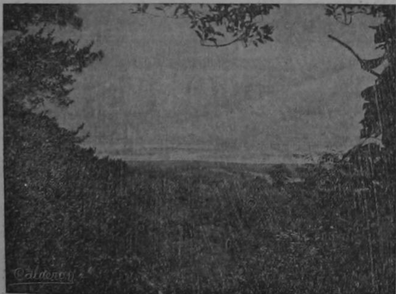
Pintoresca vista tomada desde lo alto del Cerro del Tortuguero

Por motivo de estar en mal estado una casa, ésta se derrumbó, hiriendo á varias personas, las cuales se curaron inmediatamente con solo comer el pan que elaboran los señores Negrini Hnos.