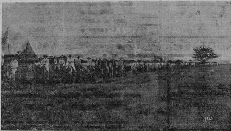
Llegada de la manifestación a Liberia