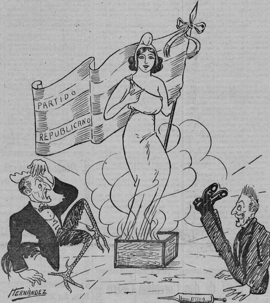
La República surge libre y triunfante de la urna electoral con la bandera de Costa Rica desplegada, ante los aterrorizados representantes de la Con-Fusión.

(Véase nuestro grabado de ayer en la 4a. plana de este número)