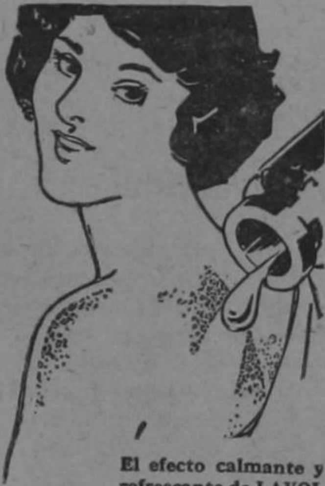
El efecto calmante y refrescante de LAVOL hará cesar la quemadura del eczema — la terrible comezón y ardor que produce.

Caronte: lleva su alma sensitiva en tu barca que quedará perfumada como un bácaro, donde dejara una flor, su esencia... Señor: sé piadoso y acógelo en tu seno... Perdónalo por que amó mucho.