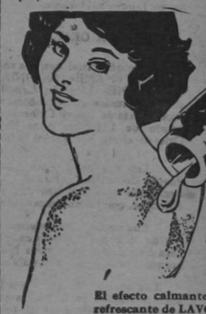
El efecto calmante y refrescante de LAVOL hará cesar la quemadura del eczema—la terrible comezón y ardor que produce.

El propietario del Hotel Victoria entiende bien estos principios y como buen maître de hotel se preocupa de ofrecer a sus clientes buena comida para satisfacer el gusto más exigente a precios razonables, que han hecho que este establecimiento adquiera una gran popularidad en esta ciudad.