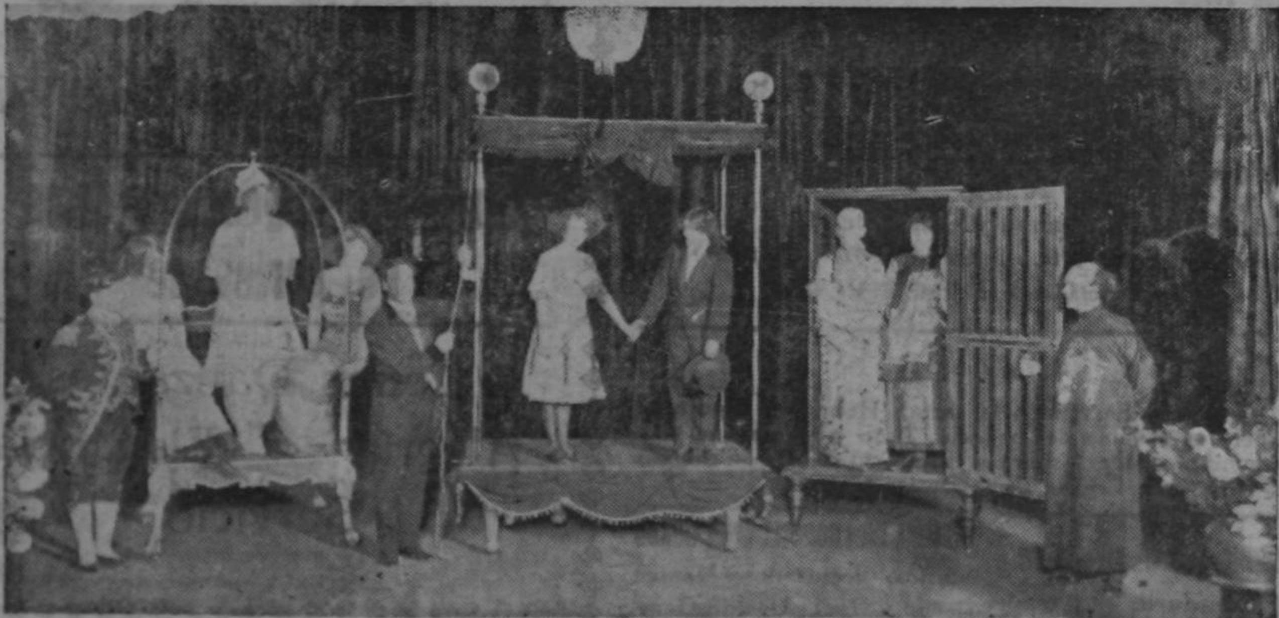
Una de las fantásticas escenas con que el señor Raymond ha maravillado al mundo que apañe sus admirables trabajos que el mismo Houdini, el famoso mago americano

Los boletos están a la venta en el Teatro Nacional