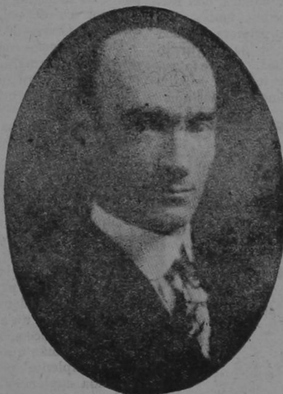
DOCTOR DON ALFREDO SKINNER KLEE Ministro de Guatemala.