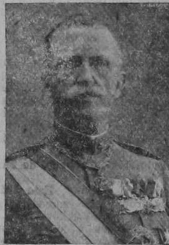
SU MAJESTAD EL REY VICTOR MANUEL III

En esta fecha se celebra el aniversario del natalicio de S. M. Victor Manuel III, Rey de Italia, quien desde la muerte de su padre, S. M. Humberto I, rige los destinos de la monarquía, dentro de un orden de paz, de trabajo y de respeto a las leyes.