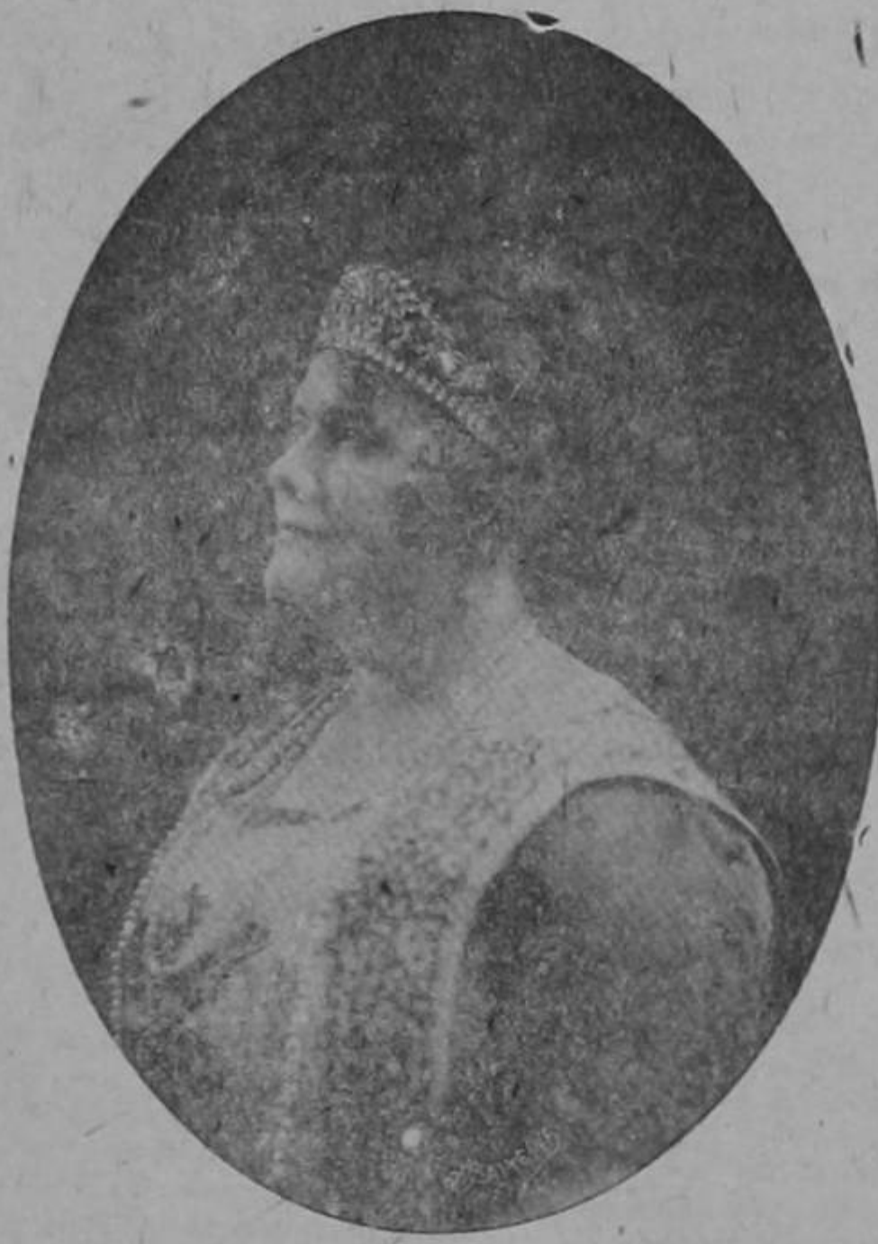
EMILIA VERGERI (Soprano)

El domingo en la noche, el Teatro América estará de gala, y el público josefino de enhorabuena, ya que la ópera es su espectáculo favorito, lo que habla muy alto de su refinado gusto artístico, con el debut de la Compañía de Ópera Italiana ODIERNO, que acaba de hacer una brillante campaña por México y las repúblicas hermanas de Centro América, durante la cual ha obtenido en buena lid, entusiastas aplausos.