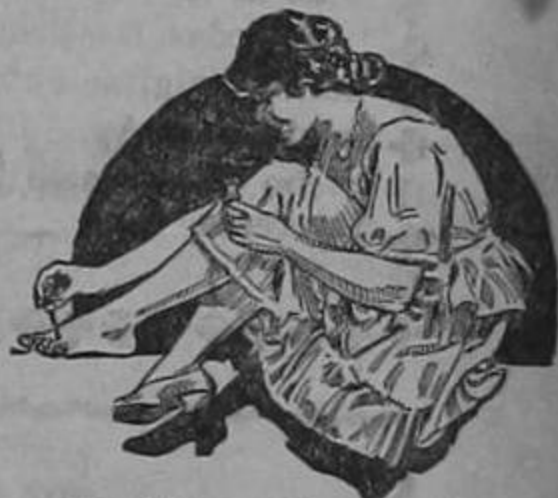
"Gets-It" Segura Muerte de Callos

Toda clase de callos y callosidades se rinden a "Gets-It" y se desprenden inmediatamente. Únicamente unos cuantos segundos y dos o tres gotas, son necesarios para eliminar el dolor. Vaya a su farmacia hoy mismo y pida una botella de "Gets-It". Fabricado por E. Lawrence & Co., Chicago, E. U. A.