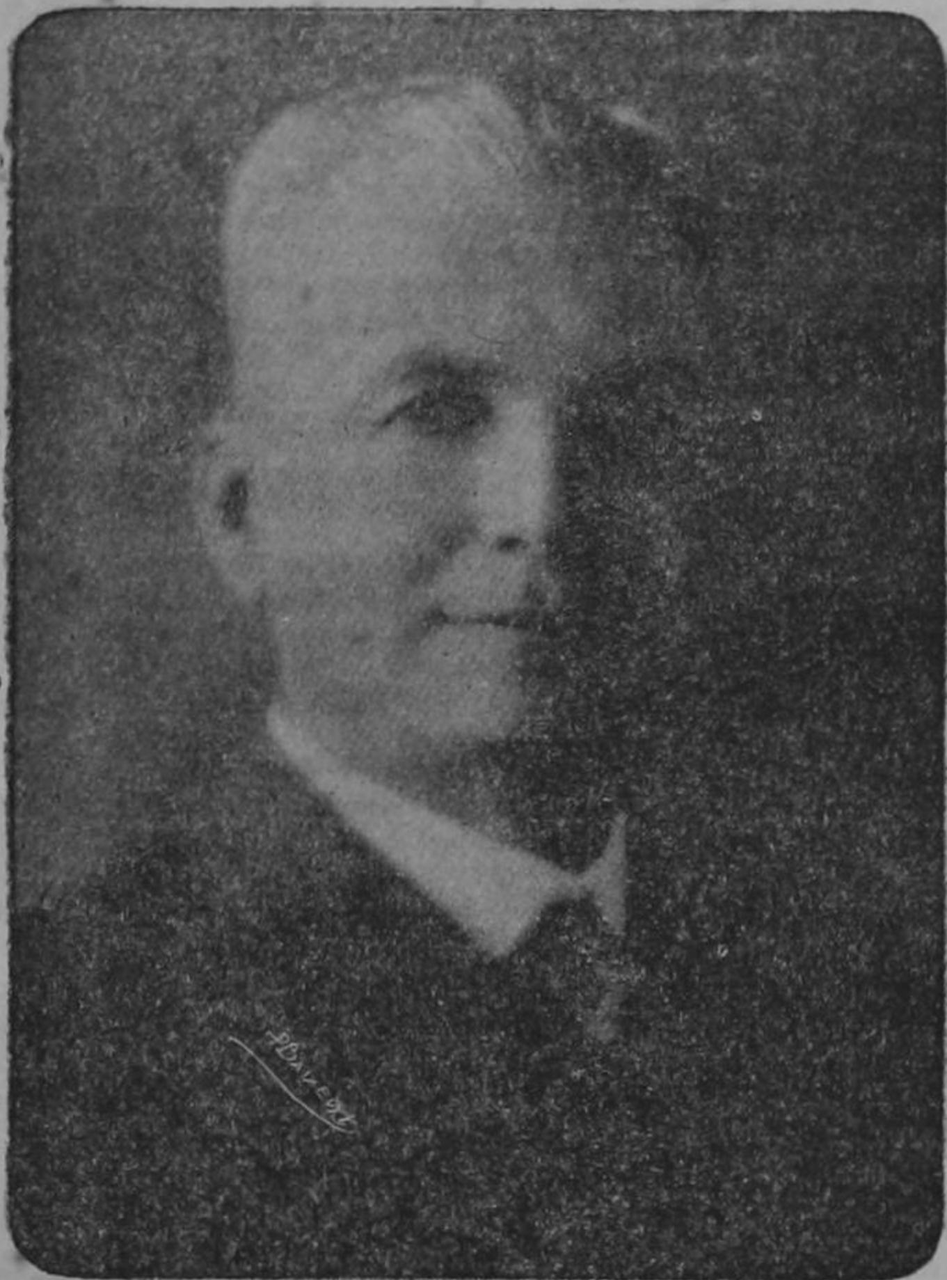
Don CARLOS SOLÓRZANO

Presidente electo para el período de 1925-1929