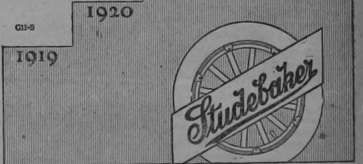
La Casa más Grande del Mundo en la Construcción de Automóviles de Calidad

Antes de comprar un automóvil, investigue por qué cada año hay más compradores que prefieren STUDEBAKERS.