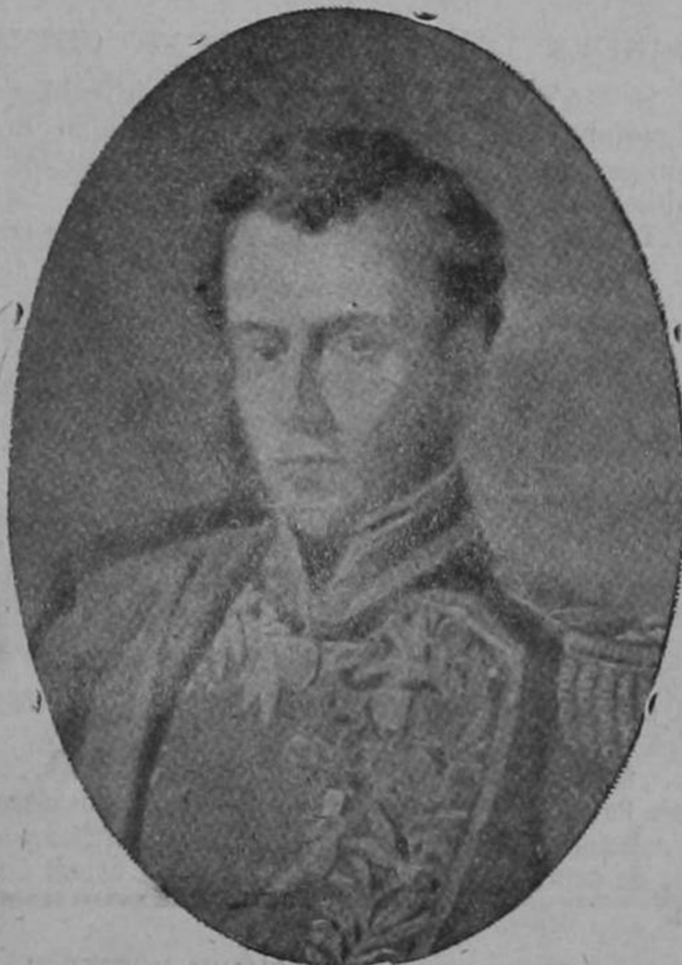
ANTONIO JOSE DE SUCRE Gran Mariscal de Ayacucho

Los ejércitos que combatieron en la memorable jornada estaban constituidos así: