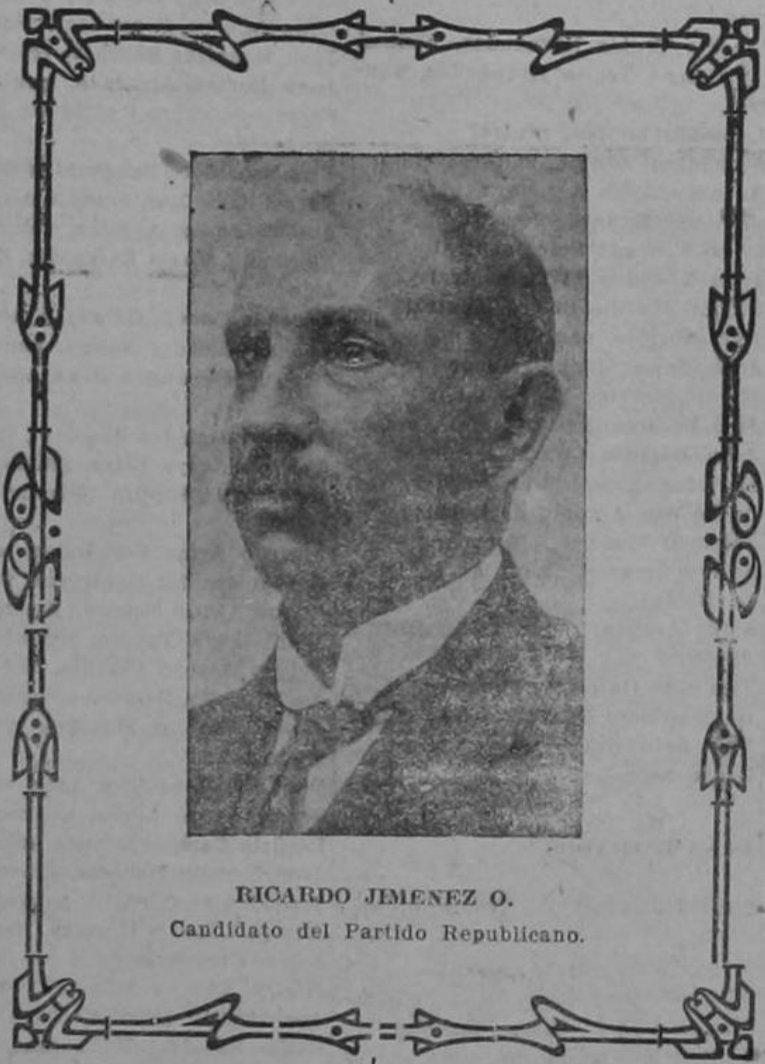
RICARDO JIMENEZ O. Candidato del Partido Republicano.