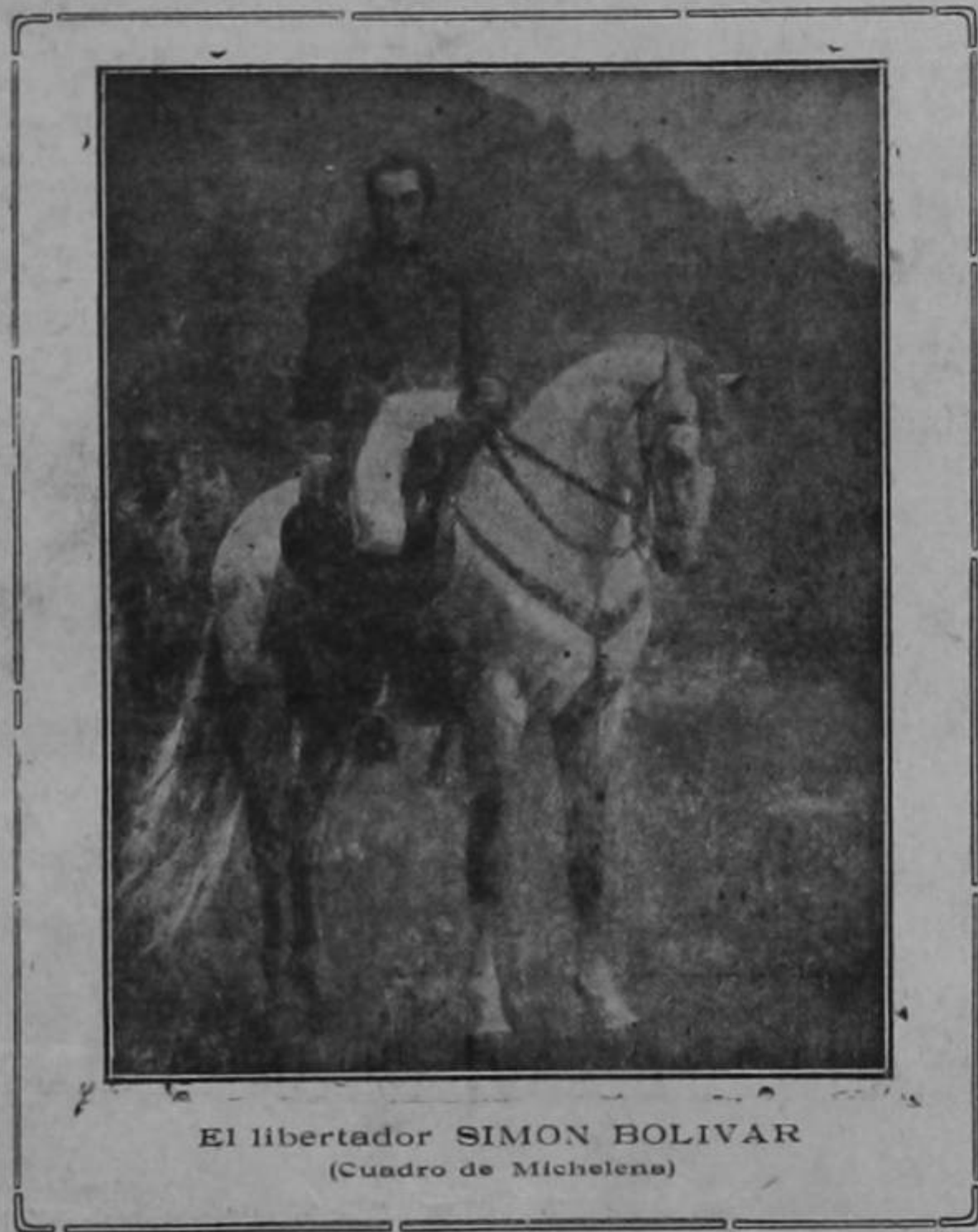
El libertador SIMÓN BOLÍVAR (Cuadro de Michelena)

Situada 50 varas al noreste del Mercado : : : San José de Costa Rica