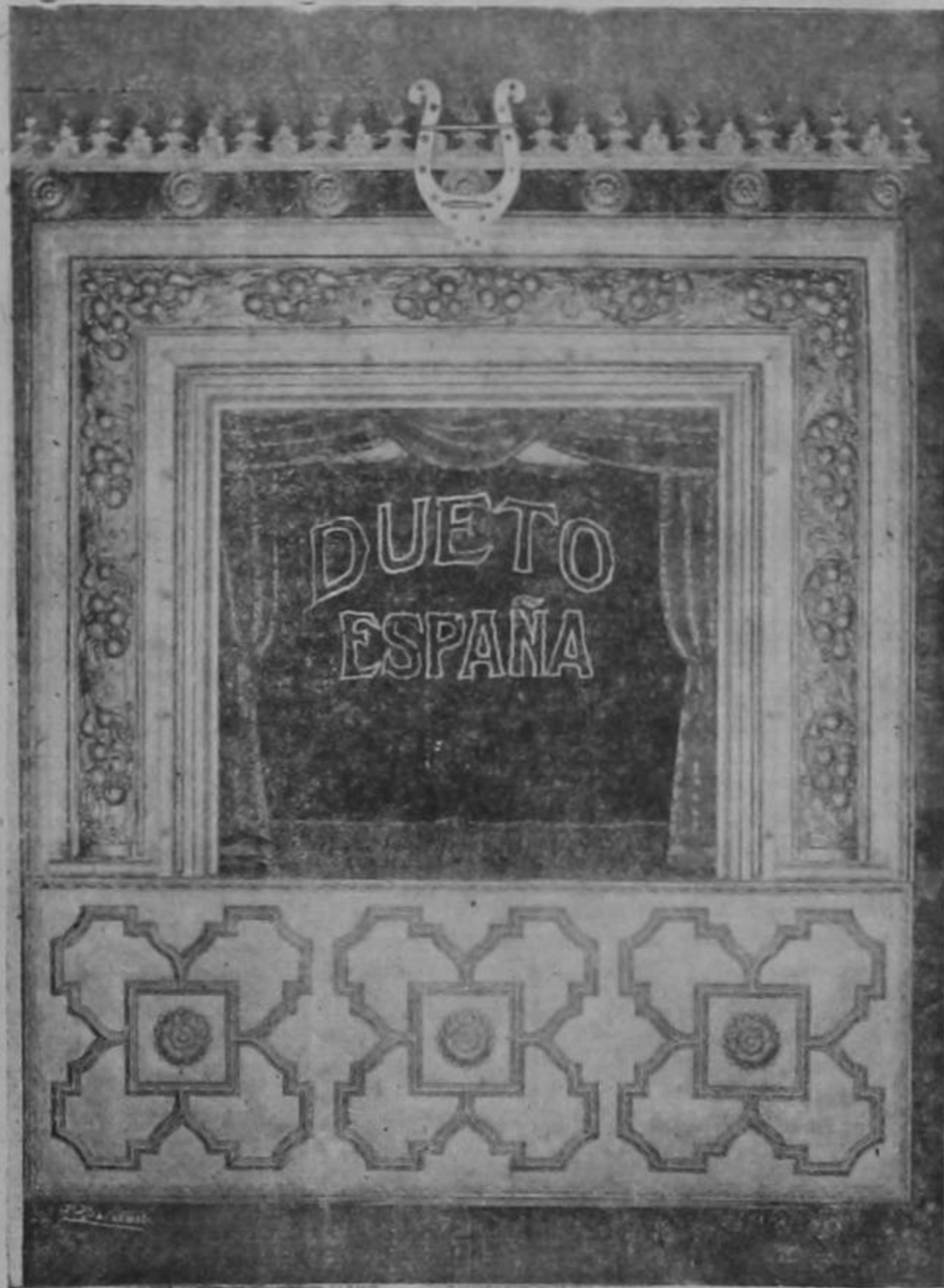
PRECIOS POPULARES: LUNETAS Y BUTACA, 50 céntimos