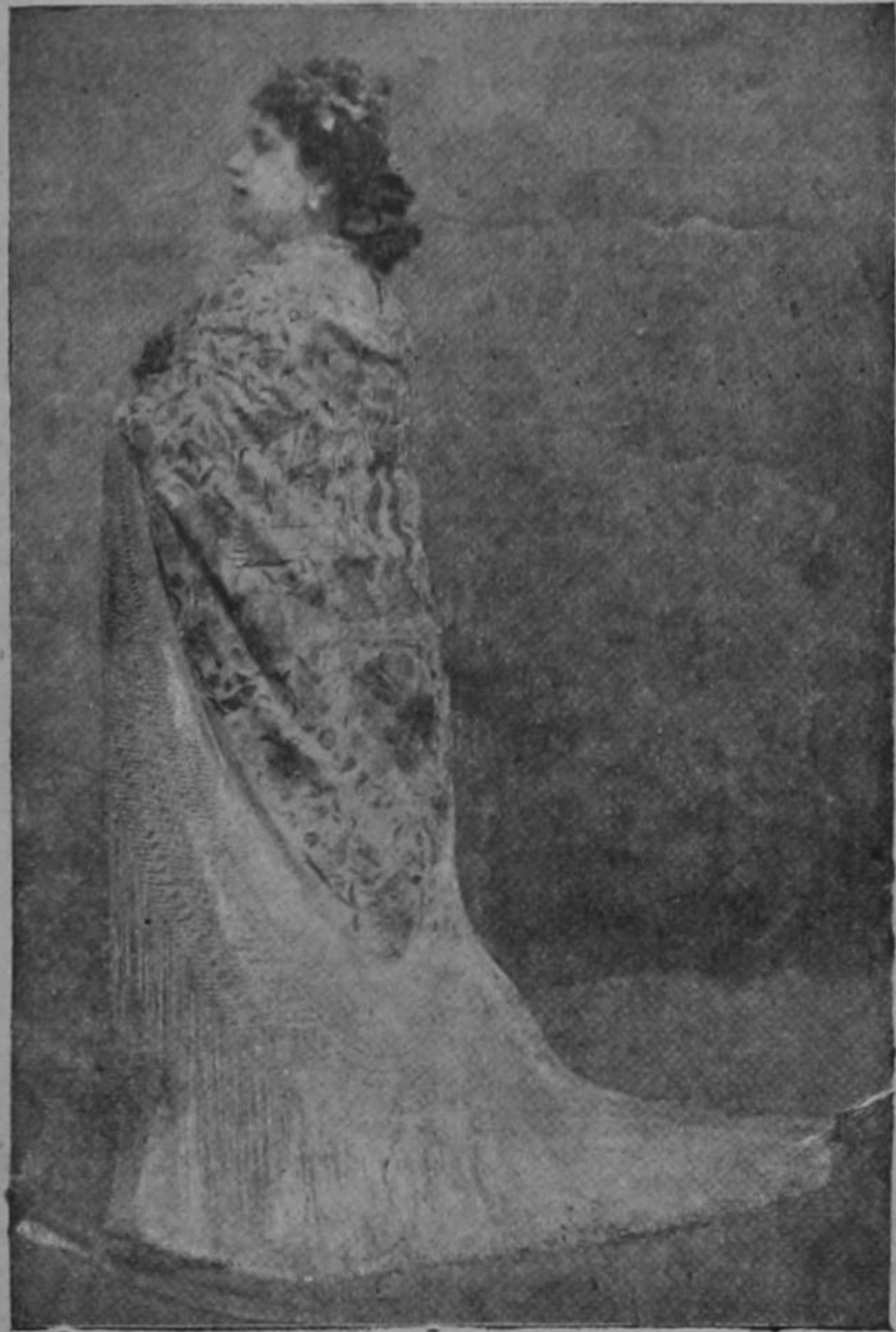
Señora Antonia Cidoncha, primera tiple cantante de la compañía que actuará en breve en el Teatro Trébol. Es una artista de cartel que indudablemente gustará al público josefino.