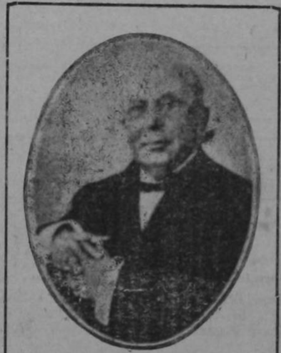
PEDRO B. PALACIOS (Almafuerte)

Nació en San Justo, Provincia de Buenos Aires, el 13 de Mayo de 1834. Murió en La Plata el 28 de Febrero de 1917, a los setenta y tres años de edad.