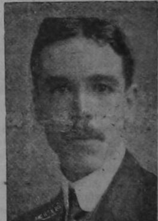
Lic. don Alfredo González Flores Segundo Designado a la Presidencia de la República