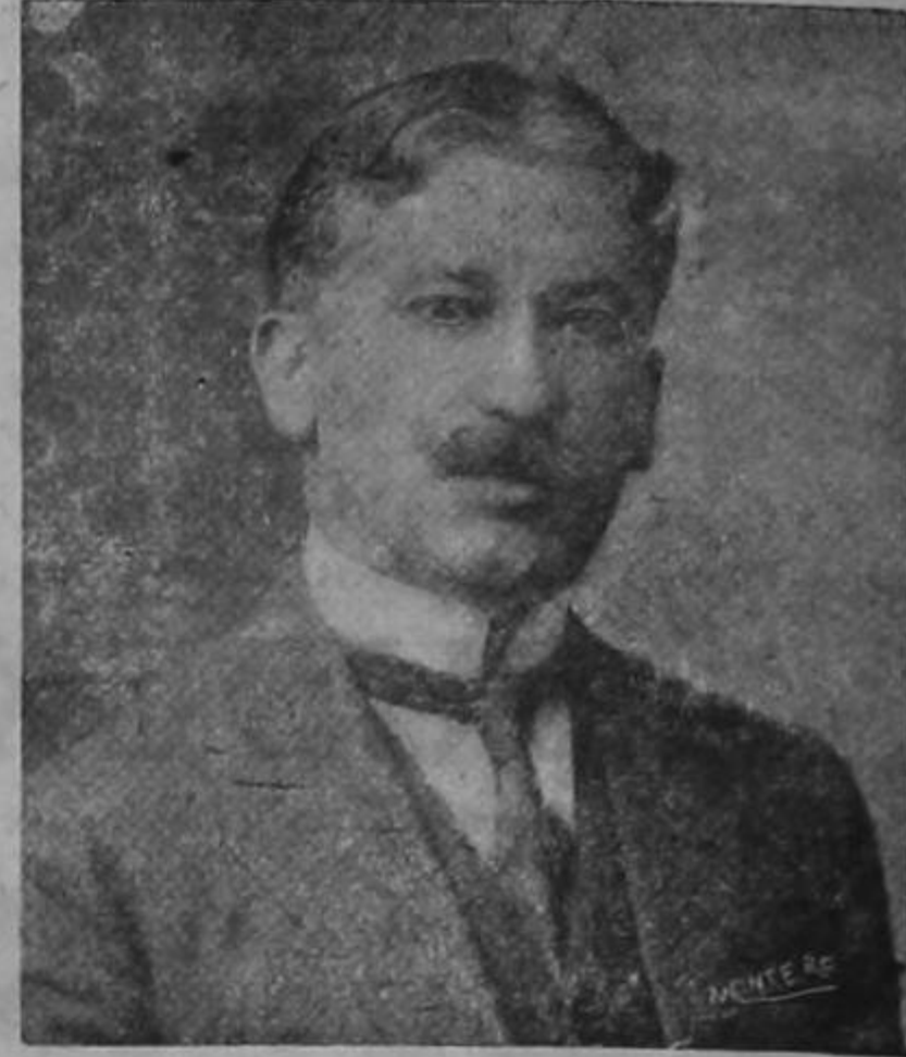
Don Julio Acosta Garcia, Presidente electo para el periodo constitucional de 1920 a 1924.

El señor Aguilar Barquero leerá un corto y sentido mensaje de despedida, al cual contestará el Presidente del Congreso y, probablemente, el de la Corte Suprema. Inmediatamente después el señor Aguilar cederá su asiento a don Julio Acosta, previo un fuerte apretón de manos, y tomará el sillón que este último ocupaba al pie de la tribuna congresil.