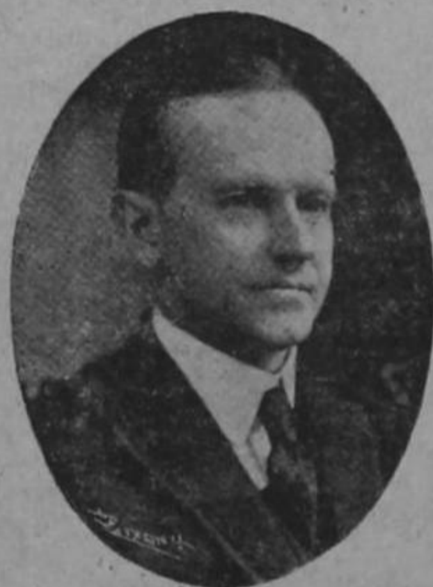
MR. CALVIN COOLIDGE,

Senador por Ohio, elegido candidato a la Presidencia, por una abrumadora mayoría.