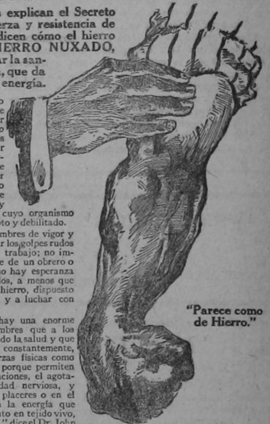
"Parece como de Hierro."