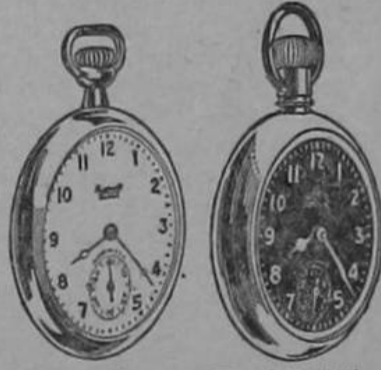
El Ingersoll con siete rubíes En el Radiolite la hora es visible en la oscuridad

El Ingersoll fue el primer reloj de precio módico, siendo indudablemente el mejor de los que, por su precio, están al alcance de todos.