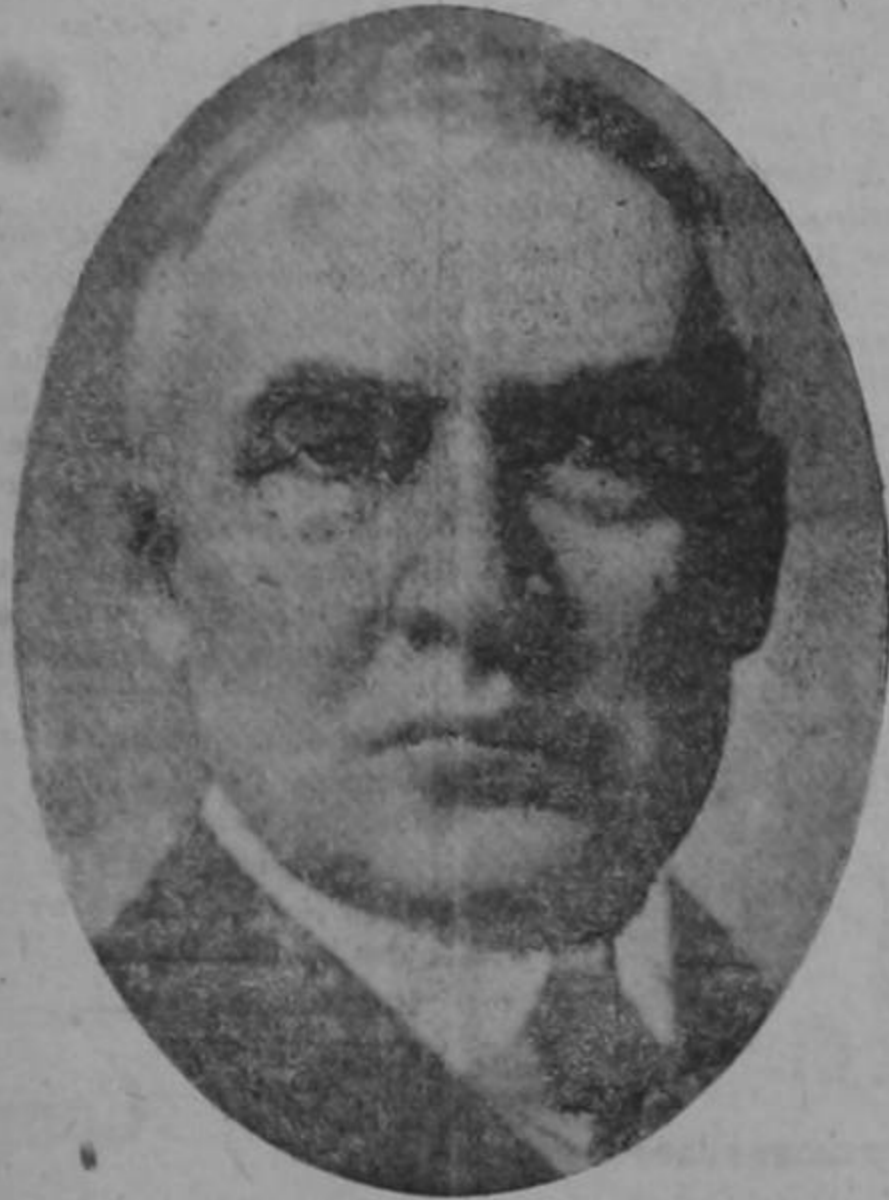
WARREN G. HARDING

Harding electo Presidente por una gran mayoría