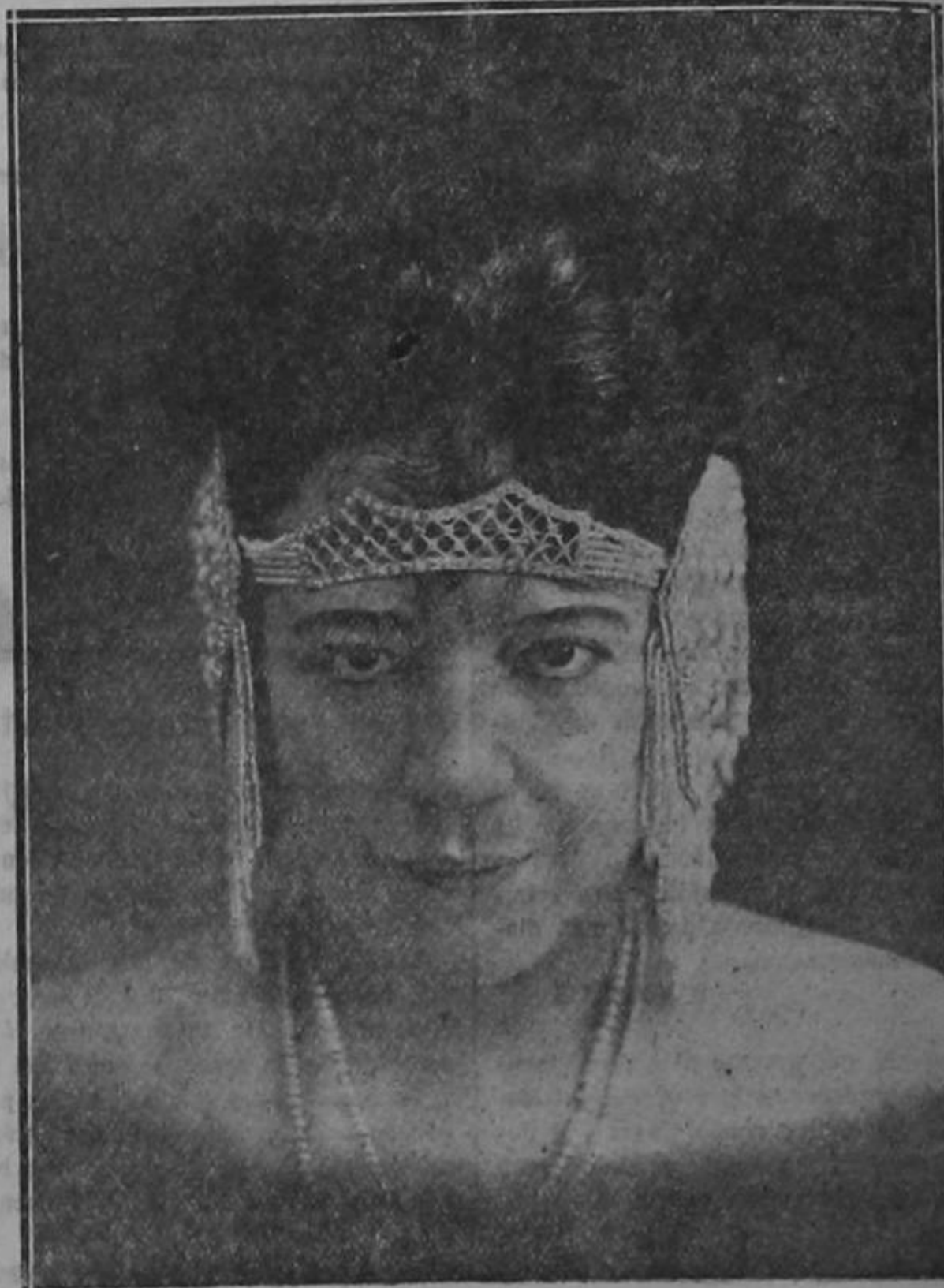
SRA. VIRGINIA FABREGAS

Aún, a pesar del tiempo que va esfumando paulatinamente los recuerdos en los desvanes donde almacena la memoria fechas, imágenes, circunstancias y acontecimientos, nos parece oírle surgir en el escenario del elegante coliseo que lleva su nombre; aún perdura en la retina la visión luminosa de la eximia; aún conserva el tímpano las vibraciones armoniosas de aquella voz incomparable que tiene un acento adecuado para cada frase, una so-