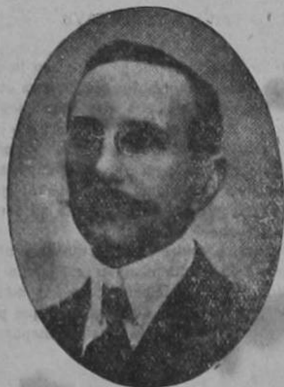
DON JORGE MELENDEZ, Presidente Constitucional de la República de El Salvador