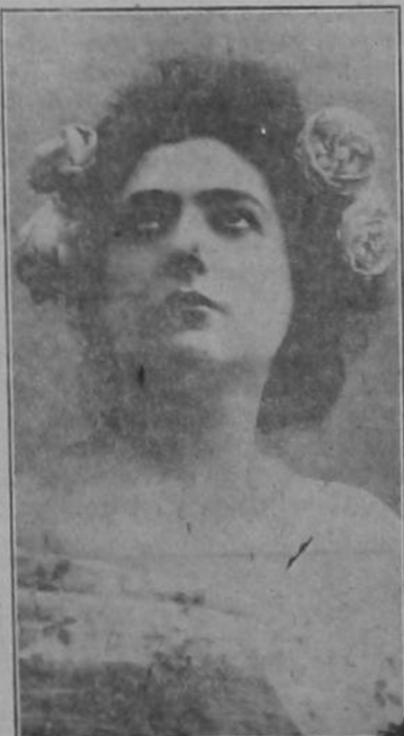
VIRGINIA FABREGAS Distinguida artista mexicana

Bajo la impresión de quien va a conversar con una mujer tan admirada por casi todo el mundo, pregunté a una camarera por la artista Virginia Fabregas.