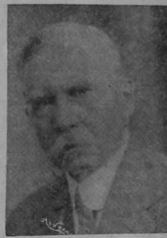
EXCELENTISIMO SEÑOR DOCTOR DON MARIANO VASQUEZ, Delegado por Honduras

Pienso que si la Unión se busca como el medio único de preservar la existencia de los Estados, todo interés debe posponerse a los grandes intereses de Centro América; por eso no he discutido fórmulas que más o menos tienden a mantener las condiciones creadas por los Estados