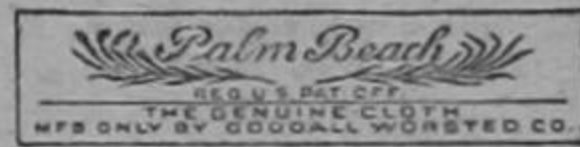
Esta marca en un traje PALM BEACH es un signo inequívoco de que ha sido confeccionado con la tela legítima.

THE PALM BEACH MILLS GOODALL WORSTED CO. Unicos manufactureros Sanford, Maine, E. U. A.