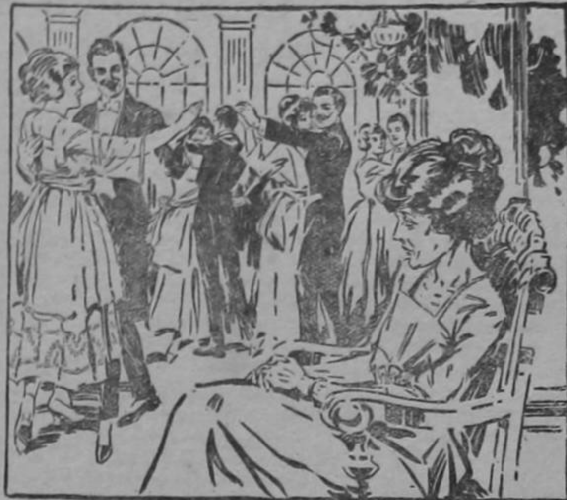
Se halla usted fuera del círculo de la felicidad por falta de robustez? Le faltan a usted Fuerza y Vitalidad para participar en los goces de la vida.

La ciencia ha producido el HIERRO NUXADO el poderoso medicamento que contribuye al bienestar y hace posible en realidad el verdadero goce de la vida. El HIERRO NUXADO es hierro orgánico y vitalizado, de fácil asimilación en la sangre y que obra maravillosamente en el orga-